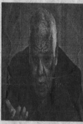
قال في هذا الشأن أنه من المستبعد

فعل الرغم من مسارعة العديد من الأسماء من التي لها وزن وصدي كبيران في الساحة السياسية، إعلان ترشحها لكن وضعت شرط عدم ترشح رئيس الجمهورية عبد العزيز بوتفليقة، باستثناء احمد بن بيتور رئيس الحكومة السابق الذي أعلن بكل صراحة ترشحه والذي كسر روتين المشهد السياسي من خلال جولته ولقائاته التي بدأها منذ أشهر، فعلى الرغم من اقتراب موعد الانتخابات إلا أن الغموض هو سيد الموقف ومستمر في التوجه نحو التعقيد (أكثر فأكثر، فبالرغم من احتمال الفترة التي تفصل عن هذا الموعد الانتخابي إلى أقل من خمسة أشهر، إلا أن الساحة السياسية لا يزال يكثفها الكثير من الضبابية وذلك نتاج معطيات ومتغيرات كثيرة داخلية وإقليمية، وتشترك كل هذه الأحزاب في الاعتقاد أن الوضع السياسي في الجزائر غير واضح، ومعاله قابلة للتغير في أية لحظة، مما يستوجب التريث والحذر خوفا من حسابات خاطئة تدفع منها لاحقا، لهذا ارتأت "التحرير" مناقشة