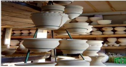
الصورة رقم 18: تمثل صناعة الفخار

3- الفخار التقليدي: إن الفخار الجزائري جد ثري ويعد بأشكاله المتنوعة وزخارفه الأنيقة أحد رموز التراث الحرفي التقليدي الجزائري، تعود جذور هذه الصناعة الفخارية إلي أزمنة غابرة إذ كانت في الماضي تستعمل في الحياة اليومية وقد بات اليوم مهدد بالانقراض في عدة جهات من الوطن.