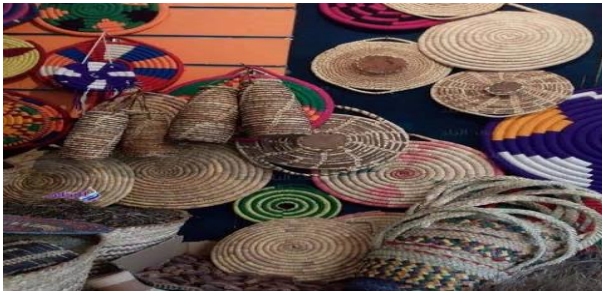
الصورة رقم 10: تمثل اواني مصنوعة من السعف

يقوم الصانع بجمع هذا السعف، فيجففه بتعريضه للشمس فلما ييبس يدخل إلى الظل ، ثم يغمس في الماء حتى يلين ويصير مطواعا للعمل، فيصنع منه أشياء عديدة كالأواني الأوعية المتفاوتة الأحجام وأدوات أخرى ذات استعمالات متنوعة، ومن هذه المصنوعات السعيفة الزنبيل والقفة والملاية والشارية والزمرور ولعلاقة وأما المظلة والمنشة فيستعملان لمقاومة حرارة المنطقة.