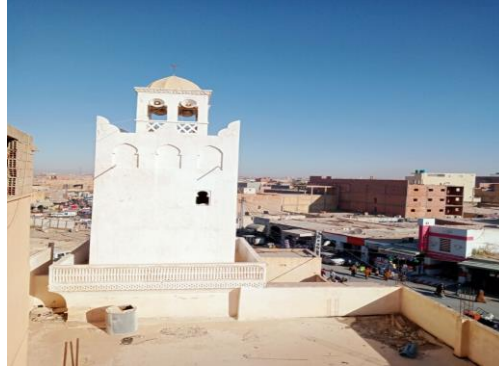
الصورة رقم 02 : تمثل زاوية سيدي سالم الوادي

2- زاوية سيدي سالم: زاوية سيدي سالم المعروفة بمنارة مسجدھا المصنف كمعلم تاريخي، وهي الزاوية التابعة إلى الطريقة الرحمانية المنتشرة في الشمال.