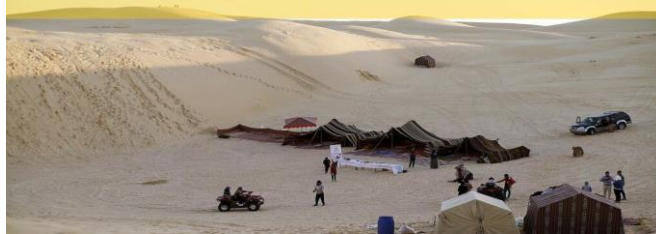
الصورة رقم 07: تمثل التخييم بصحراء الوادي