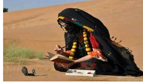
الصورة رقم 11: تمثل الحايك السوفي

ب- صناعة البرنوس: وهو لباس خاص بالرجال، ويعتبر من أهم الصناعات النسيجية بالمنطقة وخارجها، ويصنع من الصوف.