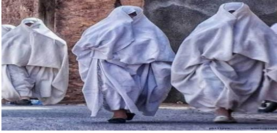
الصورة رقم 12: تمثل اللحاف السوفي