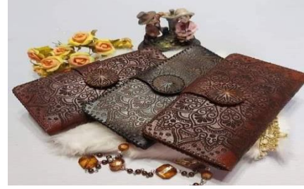
الصورة رقم 21:تمثل جزدان الجلد

ت- صناعة الخشب : يستعمل في صناعة المواعين والأدوات في خدمة الحياة اليومية، في أيامنا هذه باتت البلطة الصغيرة المستعملة في قطع الخشب تندثر أمام التقنيات الحديثة (خرط الخشب بالآلة).