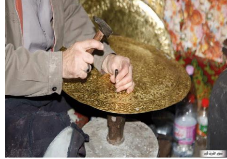
الصورة رقم 24: تمثل صناعة النحاس