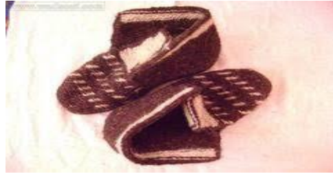
الصورة رقم15: تمثل العفان المصنوع من الصوف

ر- صناعة العفان :وهو حذاء يصنع من الصوف الأبيض وشعر الماعز الأسود الذي يتخذ أحزمة له وهي تحمي مرتديها من الرمال الباردة في فصل الشتاء ومن رمضاء الصيف المحرقة.