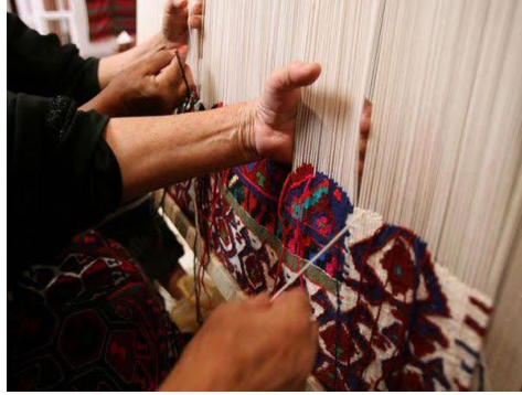
الصورة رقم 16: صناعة الزرابي

ب- صناعة مستلزمات الخيمة: إن بدو سوف كانوا يصنعون في القرن التاسع عشر كل متطلباتهم من الصوف والشعر والوبر البني الناصع الذي تصنع به الخيام، ويتكون من عدة أجزاء منها: الأفلجة والطرائق، والحنبل، وغيرها.