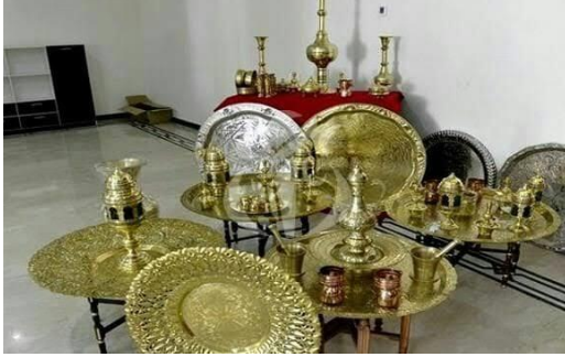
الصورة رقم 25: تمثل صناعات النحاس

صناعة الأواني النحاسية صناعة حضرية أساسا تطورت هذه الصناعة في القرون الوسطى وهي متأثرة بشكل عميق بالزخرفة والأشكال المشرقية، في أيامنا هذه تستعمل الأواني النحاسية بالخصوص في تزيين الصالونات، وازدهرت صناعة الأواني النحاسية في ولاية الوادي كونها مهتمة بهاته الصناعات التقليدية.