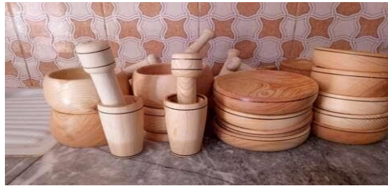
الصورة رقم 23: تمثل صناعات الخشب

ت- صناعة الخشب : يستعمل في صناعة المواعين والأدوات في خدمة الحياة اليومية، في أيامنا هذه باتت البلطة الصغيرة المستعملة في قطع الخشب تندثر أمام التقنيات الحديثة (خرط الخشب بالآلة).