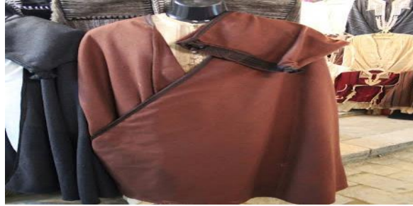
الصورة رقم 13: تمثل البرنوس السوفي

ب- صناعة البرنوس: وهو لباس خاص بالرجال، ويعتبر من أهم الصناعات النسيجية بالمنطقة وخارجها، ويصنع من الصوف.