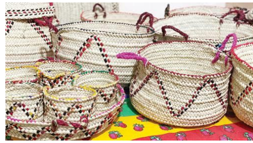
الصورة رقم 09: تمثل قفف مصنوعة من السعف