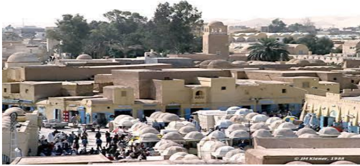
الصورة رقم 06: سوق الأعشاش الوادي

7- حي الأعشاش: حي قديم بأزقة ضيقة وبه سوق سوق الاعشاش يقع في قلب مدينة الوادي وهذا السوق مقصد لسواح الوطنيين والاجانب.