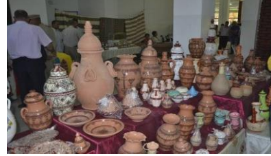
الصورة رقم 17: تمثل صناعة الفخار