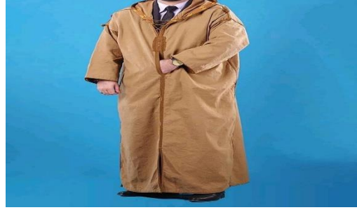
الصورة رقم14 : تمثل القشابية السوفية

ث- صناعة القشابية :وهي مثل القندورة لكنها تزيد عليها الطربوش والكمين وفي الغالب تكون مصنوعة من الصوف الخالص بعضه أبيض والآخر أسود أو تكون معلمة بالقطن أو من صوف ابيض وحده.