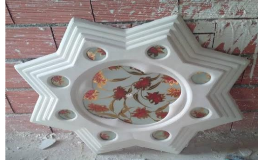
الصورة رقم 26: صناعات الجبس