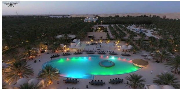
الصورة رقم 08 : تمثل فندق الغزال الذهبية