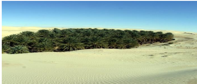
الصورة رقم 04: تمثل منطقة الغيط في الوادي