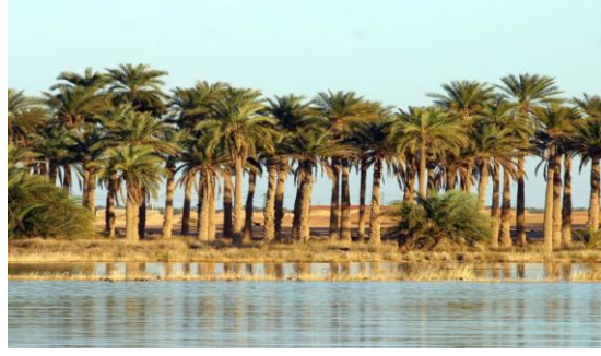
الصورة رقم 05: تمثل بحيرة العياطة الوادي

7- حي الأعشاش: حي قديم بأزقة ضيقة وبه سوق سوق الاعشاش يقع في قلب مدينة الوادي وهذا السوق مقصد لسواح الوطنيين والاجانب.