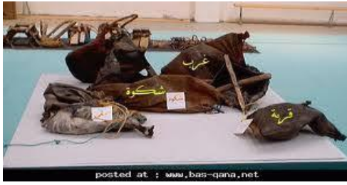
الصورة رقم 22:تمثل قرب من الجلد

نعود صناعة الجلد إلى ماض بعيد كانت الجلود المدبوغة تستعمل في صناعة الآنية والغمد والأحذية وطارقات الذباب والمخدرات والأحزمة وبرادع الأحصنة والجمال وما إلى ذلك. تنتشر صناعة الجلود من شمال البلاد إلى جنوبه وقد سمحت صلابة الجلد وسلاسته وسهولة تشكيله باكتسابه مكانة هامة في شرائح المجتمع الصحراوي خاصة والمجتمع الجزائري عامة كلها في الماضي كما في الحاضر تستدعي صناعة الجلد اهتماما خاصا.