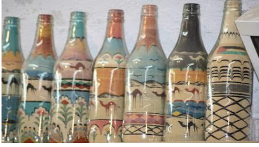
الصورة رقم 20 : تمثل الزجاجات مملوئة بالرمل