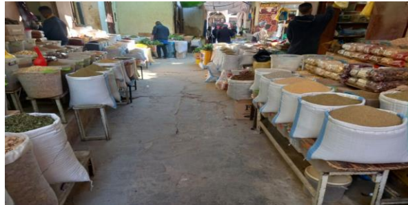
الصورة رقم 03 : تمثل سوق الوادي