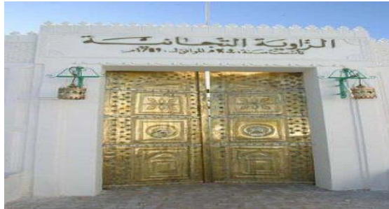
الصورة رقم 01 : الزاوية التيجانية الوادي