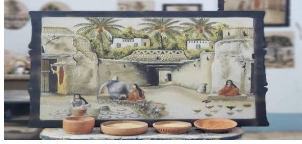
الصورة رقم 19 :لوحة رسم بالرمل الفنان أحمد وهبة الوادي