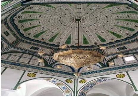
الصورة رقم 27: زخارف سقف بالجبس