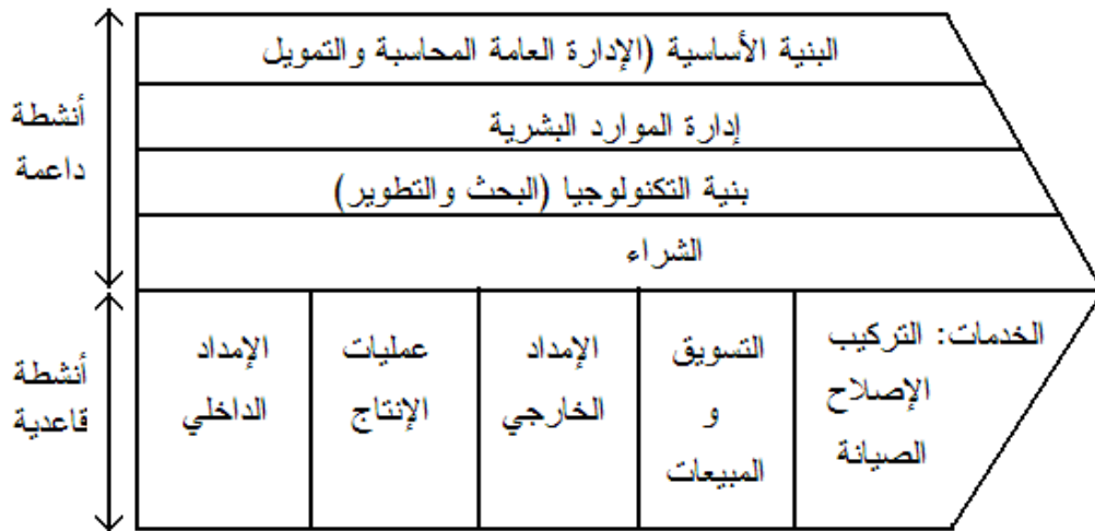
الشكل رقم (2): سلسلة القيمة للمؤسسة.

بورتر بهذا النموذج كان يسعى إلى معرفة وزن كل نشاط على مستوى المؤسسة*، ومقدار ما يحققه من قيمة، كون الأنشطة هي المسببة الرئيسة في خلق التكاليف، وهذا سيسمح للمؤسسة برسم استراتيجياتها، كأن تقوم بأخرجة بعض الأنشطة التي لا تحقق قيمة معتبرة لها. والشكل الموالي يوضح سلسلة القيمة عند بورتر.