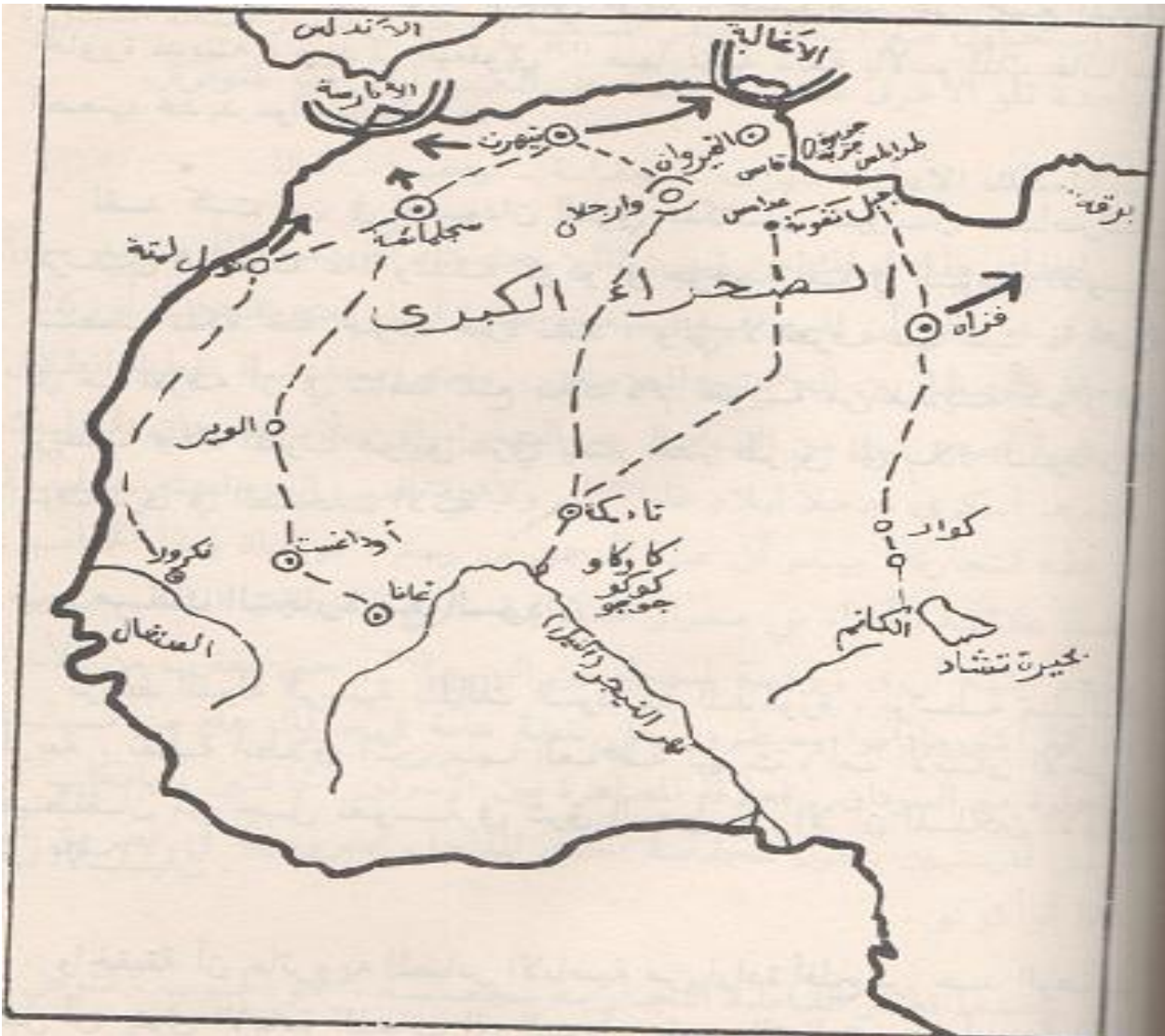
خريطة توضح الطريق التجاري الرابط بين تاهرت وسجلماسة