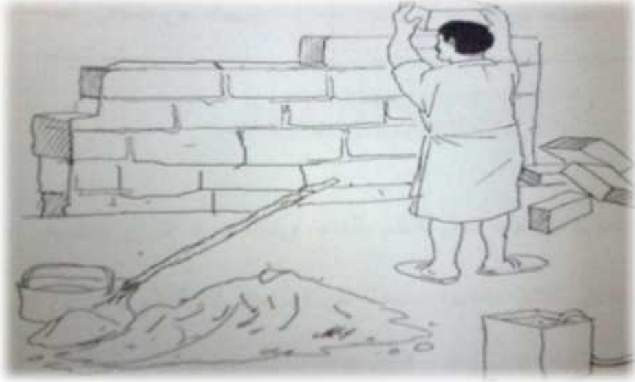
شكل 2: تمثيل الجرجاني للناظم بالبناء

فالجرجاني يشبه المتكلم بالبناء؛ حيث يختار ألفاظه المناسبة مع وضعها في المكان المناسب الذي تفترضه قواعد النحو. هذا ولم يكتف الجرجاني بمثال البناء، فأضاف مثال الصائغ الذي يختار اللآلئ ويضعها بتناسق مع بعضها البعض، والصبّاغ الذي يختار الألوان وأمكنتها المناسبة لها، كما شبه النظم بالنسج 1 .