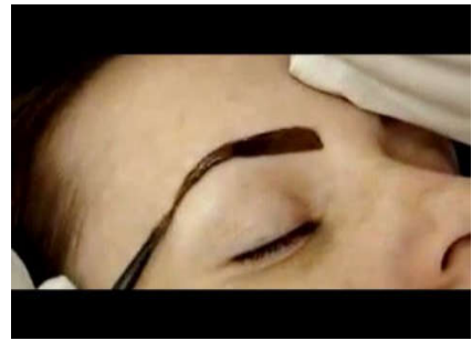
7- طريقة عمل تآثو الحنّاء