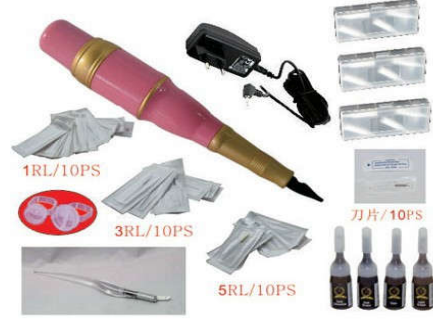
3- جهاز رسم تآثو مع مستلزماته