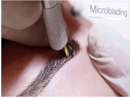
4- تآثو شَعْرَة بِشَعْرَة