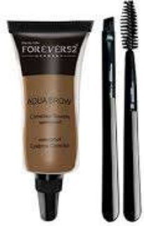
6- تآثو الحنّاء