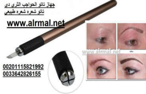
5- جهاز رسم التآثو شَعْرَة بِشَعْرَة