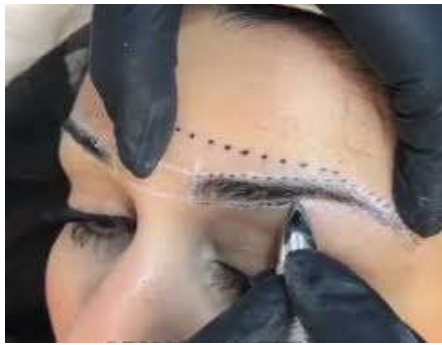
8- طريقة رسم الحواجب