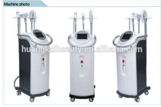
1- جهاز الليزر