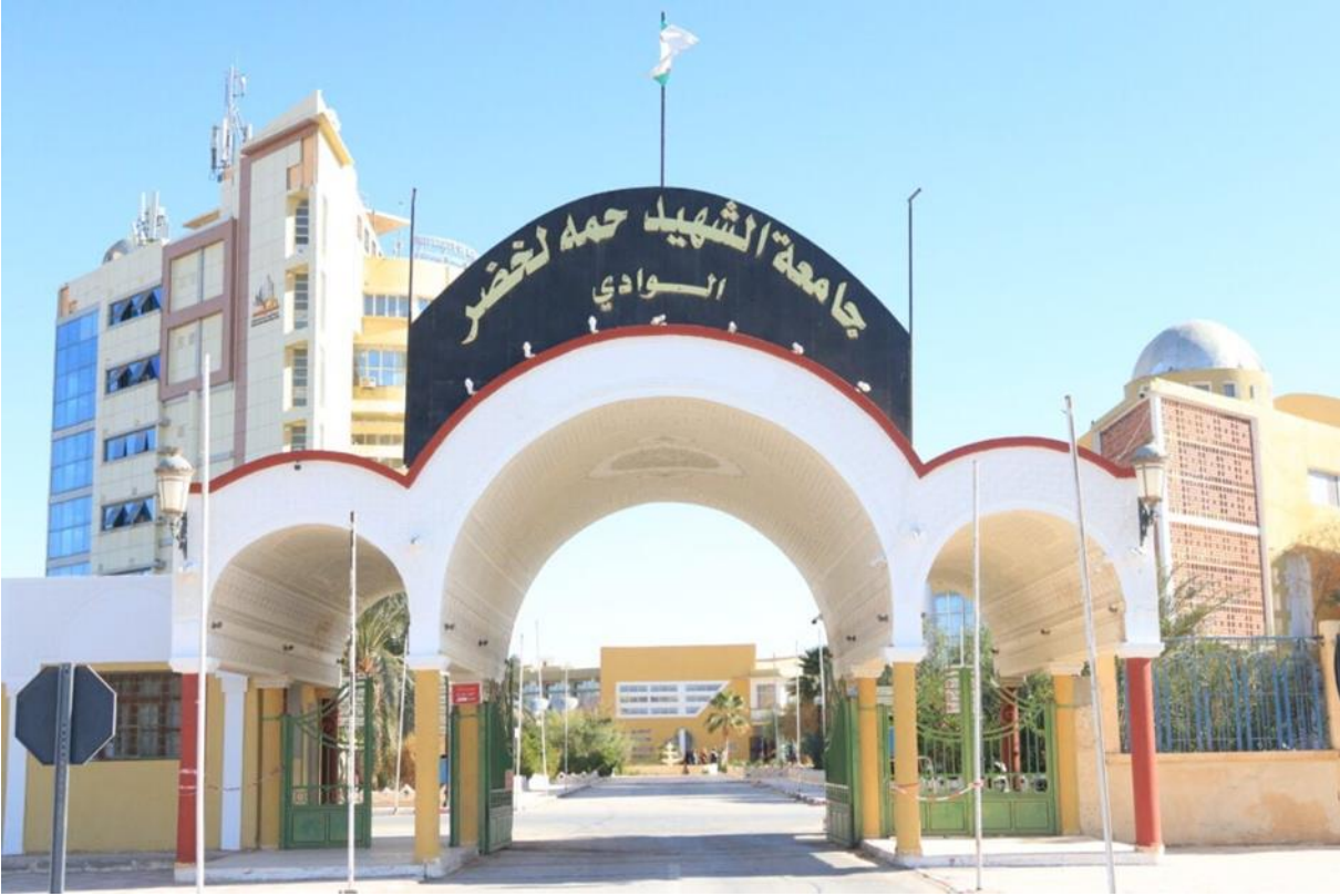
الملحق رقم 04: صورة لكلية العلوم الاجتماعية والإنسانية