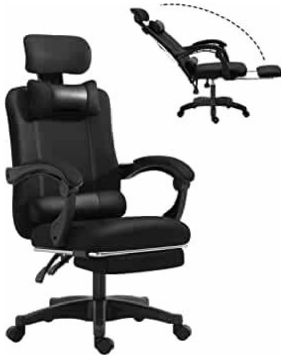
الشكل 1 كرسي متحرك مبني على تصاميم الأرغونومية.

يجب أن تكون قابلة للتعديل حسب المهمة ويمكن تعديلها بسهولة من وضع الجلوس. يجب أن يكون ارتفاع المقعد قابلاً للتعديل، ويفضل استخدام مقعد ذو الارتفاع والإنخفاض بالغاز لسهولة الضبط. يجب أن يكون للمقعد حافة أمامية منحنية لتقليل الضغط على الجانب السفلي من الفخذين. يجب تغطية كل من المقعد ومسند الظهر بقطعة قماش أو أي نوع آخر من المواد التي تسمح بالتهوية.