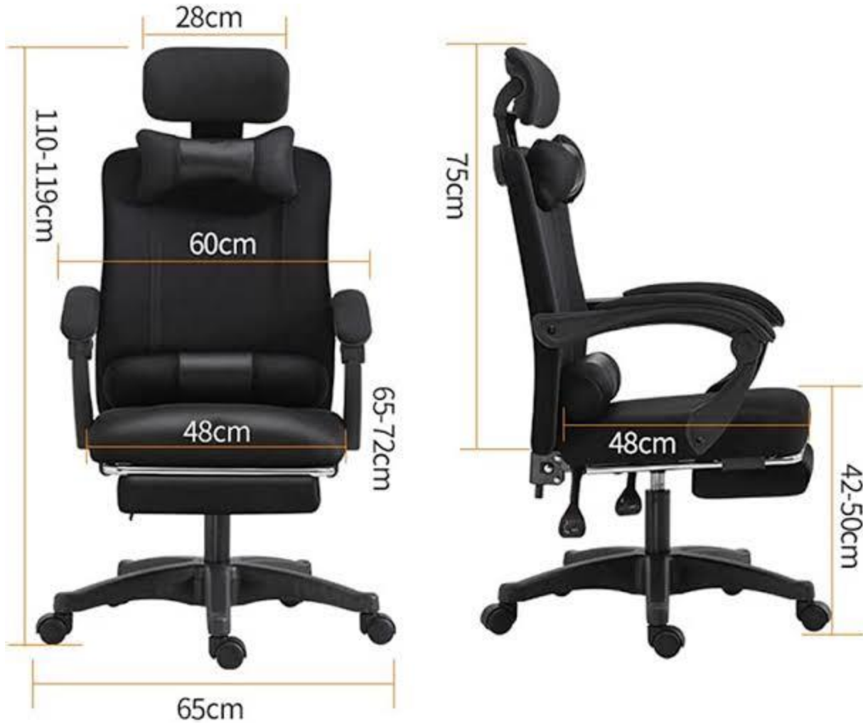
الشكل 2 صورة توضيحية كرسي متحرك مبني على تصاميم الأرغونومية بقياسات محددة.

3-3 مساحة المكتب: يعد تصميم المكاتب من أهم العناصر المادية غير المباشرة لبيئة العمل المكتبي، والتي ينبغي أخذها في الاعتبار عند تطبيق مكونات البيئة المادية. ومن أهم عناصر تصميم المكاتب مراعاة المساحات الكافية المستويات الإدارية، وتتحدد مساحات المكاتب وفق العاملين في مختلف المستويات ادارية، ويوضح ذلك الجدول التالي: