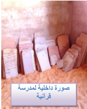
صورة داخلية لمدرسة قرآنية

1- مدرسة حرة. أو أهلية لا تستند في نشأتها إلى قرار من هيئة رسمية، ولا تتبع جهة حكومية.