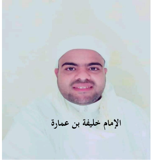
الإمام خليفة بن عمارة