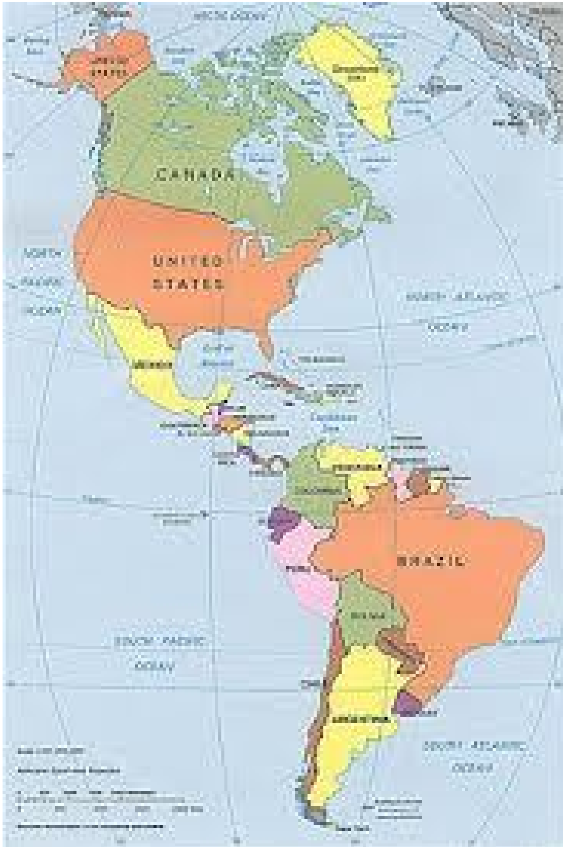
خريطة القارة الامريكية