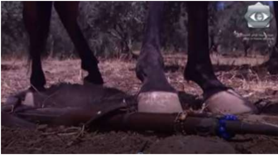
الفوتوغرام رقم ( 78 ) المستخرج من المشهد رقم ( 04 ) .

و بلقطة قريبة و بحركة كاميرا تباينت بين الثابتة و البانورامية من الأعلى إلى الأسفل و اليمين إلى اليسار و زاوية عادية تم تصوير لحظة وقوع العبد فوق حصانه ثم إفلاته لبندقيته لتقع على الأرض ، إن تصوير هذه اللقطات كان الغرض منها توضيح أن العبد قد استشهد و قد تجسدت هذه الرسالة في لحظة افلات العبد لبندقيته بعدما كان متمسكا بها بدرجة كبيرة ، حتى التمسك الذي كان يقوم به العبد قبل أن يتلفظ أنفاسه الأخيرة حمل معاني ضمنية أراد من خلالها المخرج حاتم علي إيصالها للمشاهد و هي أن الفلسطيني يبقى متشبثا و مقاوما رغم كل الظروف و لا يتخلى عن سلاحه حتى آخر رمق .