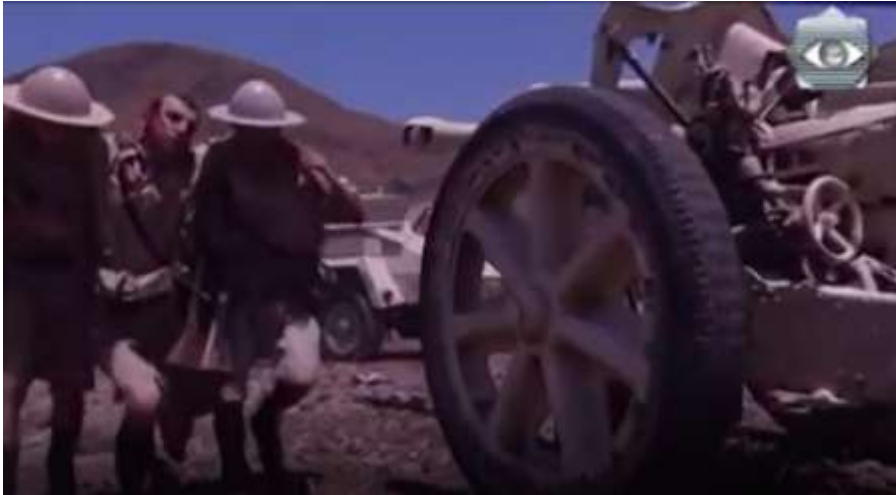
الفوتوغرام رقم ( 80 ) المستخرج من المشهد رقم ( 04 ) .

و بحركة كاميرا جمع فيها المخرج حاتم علي البانوراما الأفقية " من اليمين إلى اليسار و العكس " و البانوراما العمودية " من الأعلى إلى الأسفل و العكس " و صوّرت خضرة بملامح ظهر فيها الخوف و الشعور بالخطر و بحدوث شيء ما سيء و كأن الرسالة الضمنية المطروحة ضمن هذه اللقطة هي الترابط و الحب بينها و بين العبد لدرجة شعورها بالخطر فور استشهاده . حيث إستخدمت موسيقى بلحن حزين على الكمان و كانت مدموجة بأغنية شعبية تراثية فلسطينية هي الظاهر أغنية مخصصة للعrsان قد يعتقد المشاهد للوهلة الأولى أنها تدل على خضرة و العبد بإعتبارهما عرسانا جدد و لكن ضمنا حملت معنى أراد المخرج حاتم علي إيصاله للمشاهد هو أن الفلسطينيين يعتبرون الشهيد و كأنه عريسا و لكن ليس عريسا عاديا و إنما عريسا في الجنة .