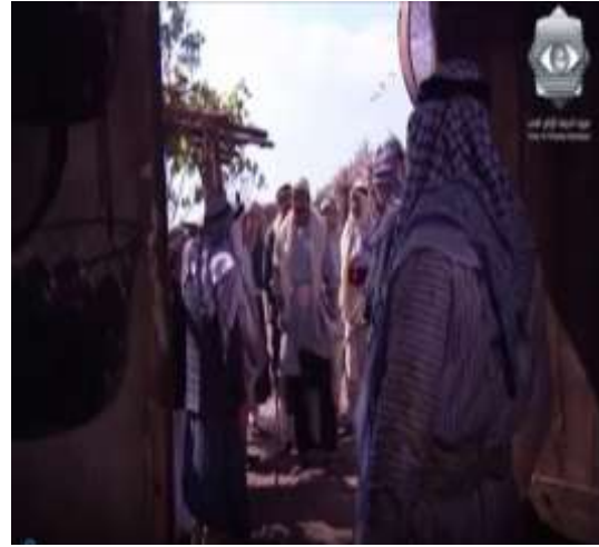
الفوتوغرام رقم ( 14 ) المستخرج من المشهد رقم ( 01 ) . الفوتوغرام رقم ( 15 ) المستخرج من المشهد رقم ( 01 ) .