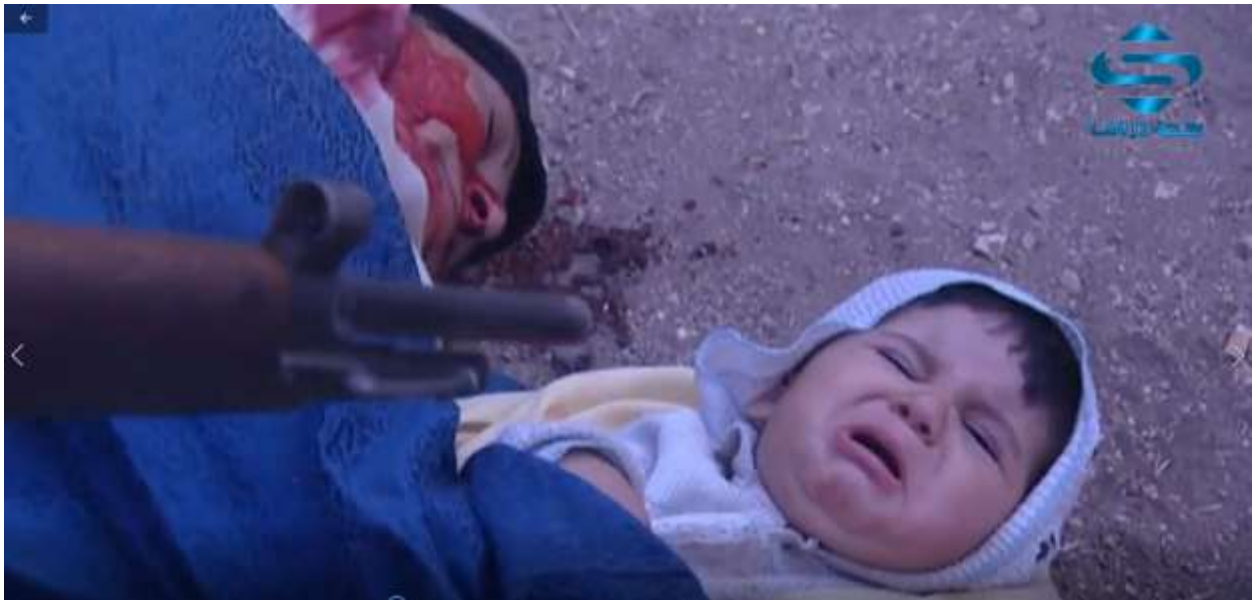
الفوتوغرام رقم ( 106 ) المستخرج من المشهد رقم ( 06 ) .

ففي لقطة صور فيها المخرج أم أحمد و هي تخبئ المفتاح في صدرها و هي اللب الكبير و دليل على أصل العودة و أن الفلسطيني لم و لن ينسى أرضه ، و هي صورة مطابقة للواقع تماما ، فكبار السن المهجرين و الذين عاشوا فترة التهجير لا يزالون يحتفظون بمفاتيحهم و يعطونها لأحفادهم ليتوارثوا حب الوطن و العودة .