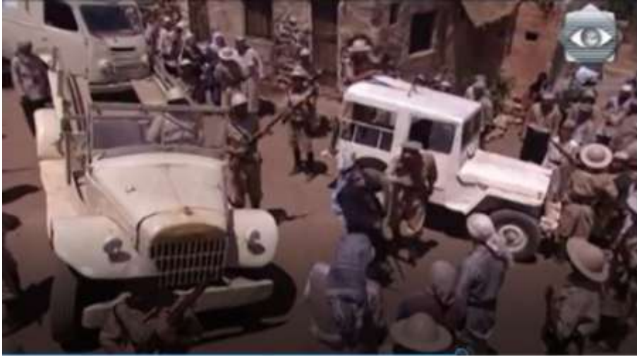
الفوتوغرام رقم ( 97 ) المستخرج من المشهد رقم ( 04 ) .

و بزواوية غطسية تم تصوير سيارات جيش الاحتلال في ساحة القرية حيث تجمع العديد من أهل القرية بعد ما تم جلبهم بالقوة من منازلهم . و أراد المخرج حاتم علي من هذه اللقطة هو إيصال فكرة أن المحتل الإنجليزي لا يفرق بين المواطن العادي البسيط و المخاتير و أعيان القرية و قد اتضح هذا في جلبه لهما بالقوة .