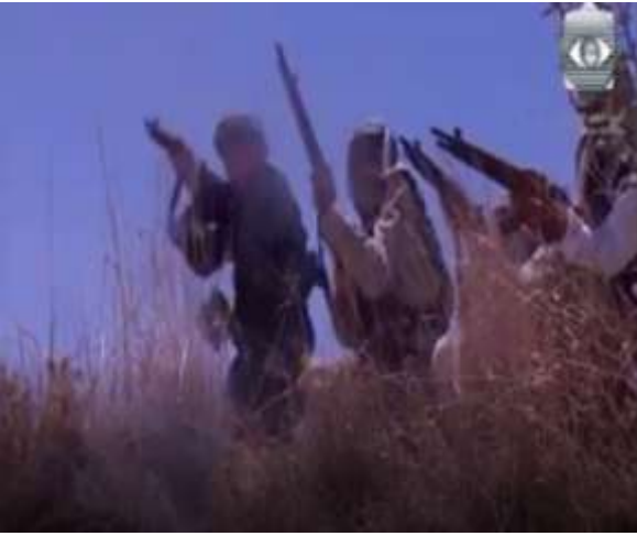
الفوتوغرام رقم ( 67 ) المستخرج من المشهد رقم ( 04 ) .