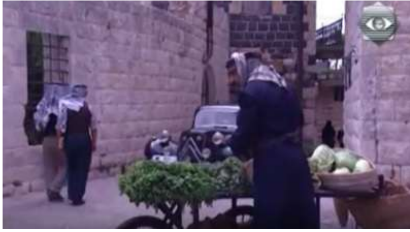
الفوتوغرام رقم ( 42 ) المستخرج من المشهد رقم ( 03 ) .

و قد دار هذا المشهد في تصوير داخلي و خارجي ضمن محيط مركز جيش الاحتلال الإنجليزي و داخله ، و تدور فكرته في سعي أحمد إلى قتل الضابط الإنجليزي انتقاما منه لإعدام جيش الاحتلال لصديقه فوزي ، حيث كان أحمد يراقب لحظة خروج الضابط لفترة مطولة و هو بجانب عربة خضر استخدمها للتمويه . و لم يستثنى الضابط الإنجليزي من حسابات المخرج حاتم علي حيث صوّره أكثر من مرة و هو جالس في مكتبه و لكن لب المشهد هو لحظة خروجه من مكتبه أولا ثم خروجه من المركز ثانيا ، و لقد نوع المخرج حاتم علي في استخدام اللقطات و حركات الكاميرا المختلفة في تصوير هذا المشهد ، حيث اعتمد على اللقطتين الخصرية و الأمريكية