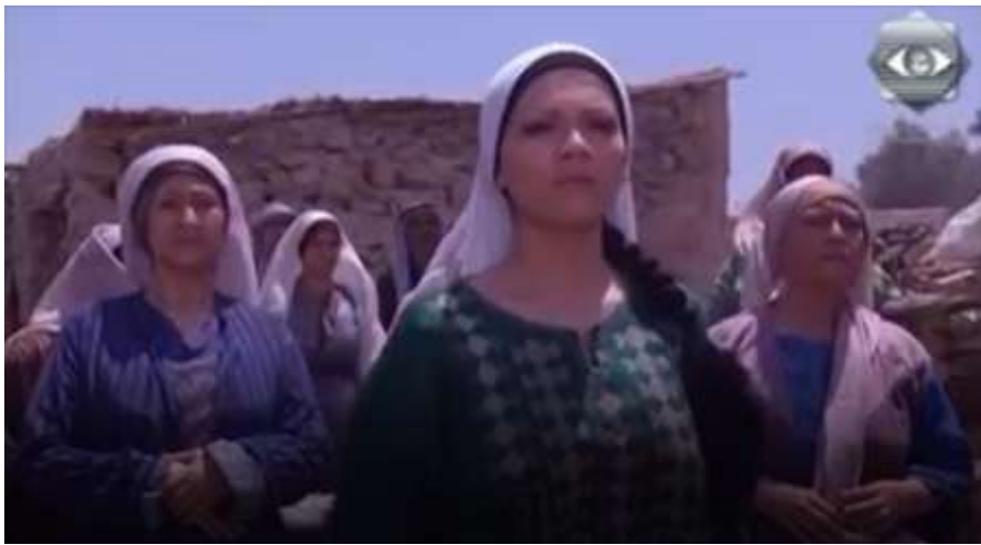
الفوتوغرام رقم ( 90 ) المستخرج من المشهد رقم ( 04 ) .

ثم تم تصوير انتظار أهل القرية لأبو صالح و المقاومين و استقبالهم بحفاوة وسط تعالي زغاريد النسوة تقديرا لانتصارهم ضد جيش الاحتلال الإنجليزي ، و في عدة لقطات مختلفة صوّرت خضرة و هي تنتظر إليهم بحيرة و خوف و قلق .