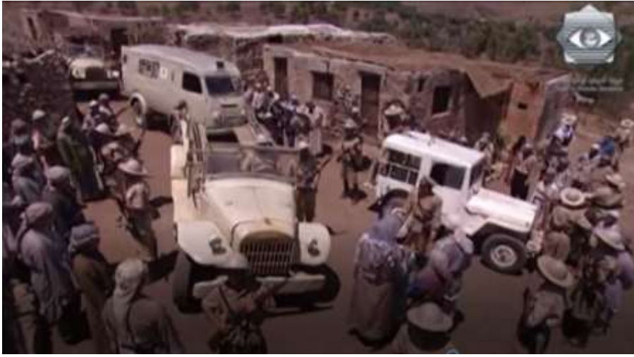
الفوتوغرام رقم ( 96 ) المستخرج من المشهد رقم ( 04 ) .

و بزواوية غطسية تم تصوير سيارات جيش الاحتلال في ساحة القرية حيث تجمع العديد من أهل القرية بعد ما تم جلبهم بالقوة من منازلهم . و أراد المخرج حاتم علي من هذه اللقطة هو إيصال فكرة أن المحتل الإنجليزي لا يفرق بين المواطن العادي البسيط و المخاتير و أعيان القرية و قد اتضح هذا في جلبه لهما بالقوة .