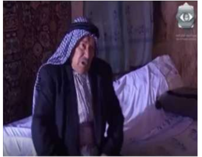
الفوتوغرام رقم ( 04 ) المستخرج من المشهد رقم ( 01 ) . الفوتوغرام رقم ( 05 ) المستخرج من المشهد رقم (01) .