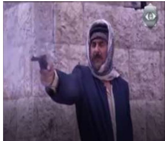
الفوتوغرام رقم ( 48 ) المستخرج من المشهد رقم ( 03 ) . الفوتوغرام رقم ( 49 ) المستخرج من المشهد رقم