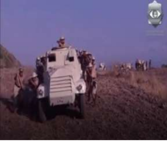
الفوتوغرام رقم ( 65 ) المستخرج من المشهد رقم ( 04 ) .

المرجح أن الفكرة الثانية هي التي أراد المخرج حاتم علي إيصالها خاصة و أن أبو عزمي رجل مغرور نوعا ما حيث استغرق وقتنا طويلا ليساند أحمد و رفقائه .