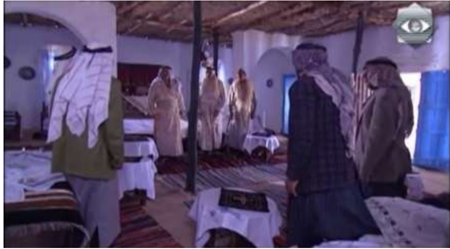
الفوتوغرام رقم ( 06 ) المستخرج من المشهد رقم ( 01 ) .