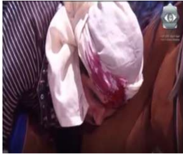
الفوتوغرام رقم ( 76 ) المستخرج من المشهد رقم ( 04 ) . الفوتوغرام رقم ( 77 ) المستخرج من المشهد رقم ( 04 ) .