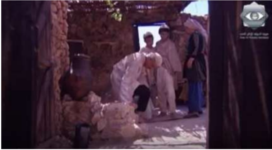
الفوتوغرام رقم ( 21 ) المستخرج من المشهد رقم ( 01 ) .

ثم تم التصوير في منزل أبو أحمد في فكرة مغايرة تماما و بعيدة عن قضية أرض المشاع ، حيث كان أبو أحمد يتبادل أطراف الحديث بالإجابة عن تساؤلات ابنه حسن ، و قد اكتفى المخرج باستخدام 03 لقطات ضمن هذا الديكور و هي اللقطة المتوسطة و الكتفية و الأمريكية ، أما الزاوية فكانت عادية طيلة التصوير في هذا المشهد ، أما بالنسبة لحركات الكاميرا فقد استخدمت الحركة الثابتة و البانورامية سواء كانت بانوراما أفقية " من اليمين إلى اليسار و العكس " أو بانوراما عمودية " من الأعلى إلى الأسفل و العكس " ، و لم تستثنى أم أحمد من حسابات المخرج حاتم علي حيث صوّرها بداية الديكور و نهايته ، حيث كانت تشطف الأرض في بداية اللقطة و كذا في نهايتها بعدما طلبت منهم مغادرة المكان كما هو موضح في الفوتوغرام رقم 18 .