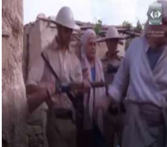
الفوتوغرام رقم ( 94 ) المستخرج من المشهد رقم ( 04 ) . الفوتوغرام رقم ( 95 ) المستخرج من المشهد رقم ( 04 ) .