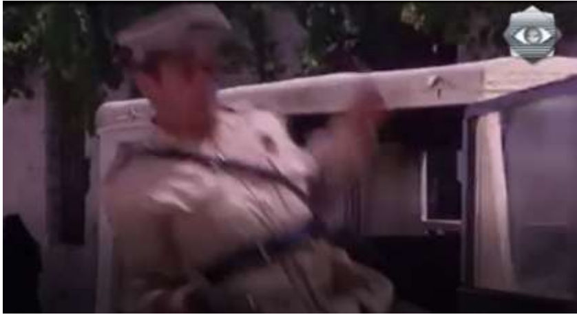
الفوتوغرام رقم ( 50 ) المستخرج من المشهد رقم ( 03 ) .