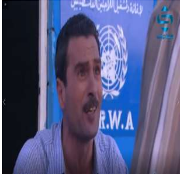
الفوتوغرام رقم ( 116 ) المستخرج من المشهد رقم ( 08 ) . الفوتوغرام رقم ( 117 ) المستخرج من المشهد رقم ( 08 ) .