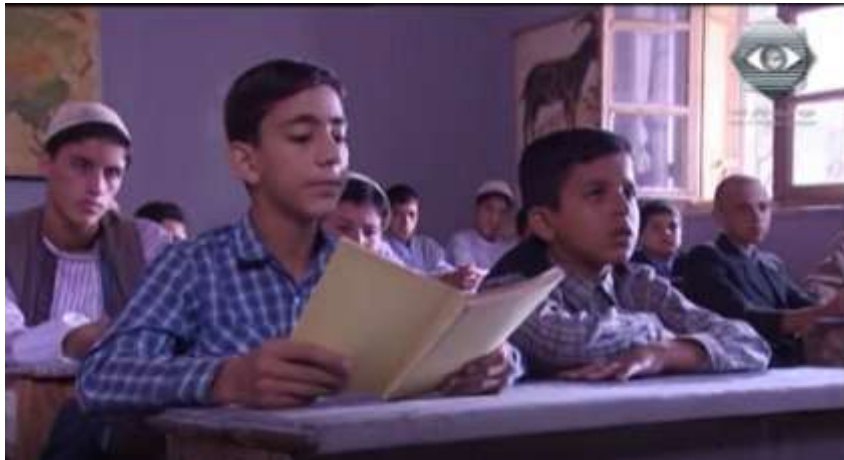
الفوتوغرام رقم ( 34 ) المستخرج من المشهد رقم ( 02 ) .