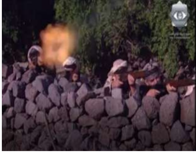
الفوتوغرام رقم ( 64 ) المستخرج من المشهد رقم ( 04 ) .