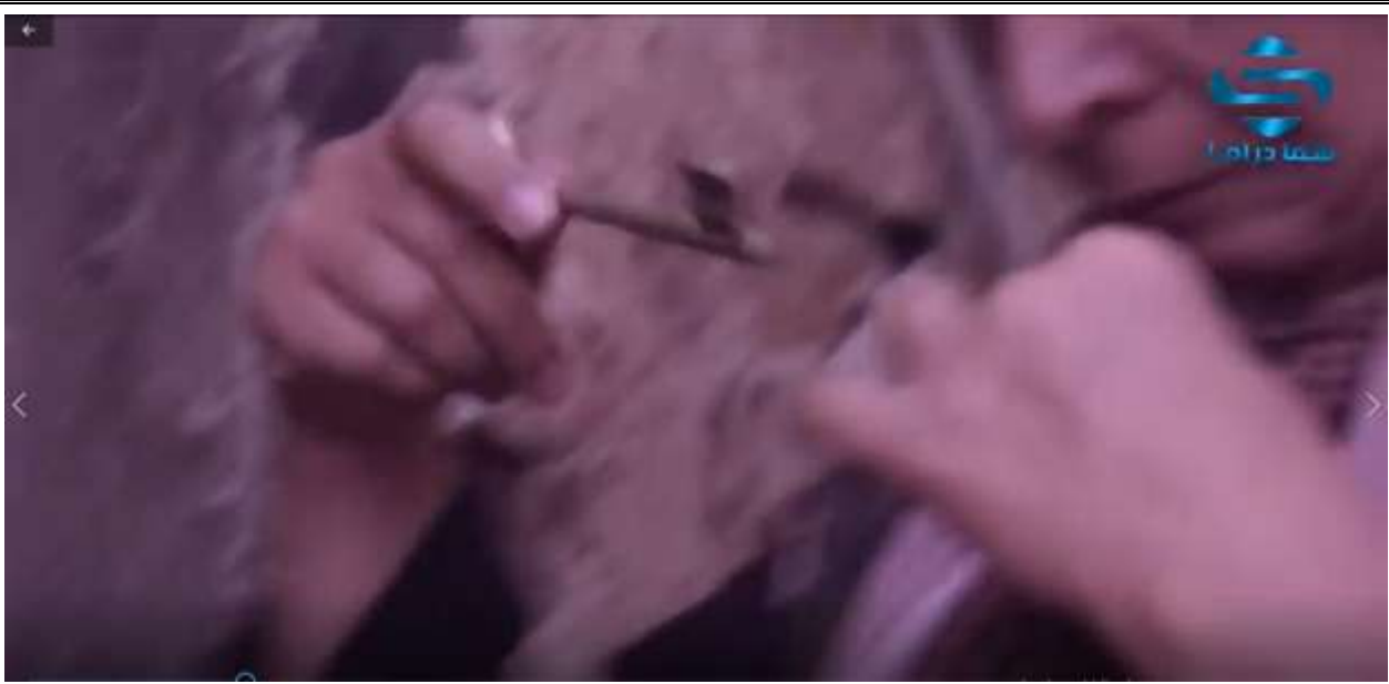
الفوتوغرام رقم ( 105 ) المستخرج من المشهد رقم ( 06 ) .

ففي لقطة صور فيها المخرج أم أحمد و هي تخبئ المفتاح في صدرها و هي اللب الكبير و دليل على أصل العودة و أن الفلسطيني لم و لن ينسى أرضه ، و هي صورة مطابقة للواقع تماما ، فكبار السن المهجرين و الذين عاشوا فترة التهجير لا يزالون يحتفظون بمفاتيحهم و يعطونها لأحفادهم ليتوارثوا حب الوطن و العودة .