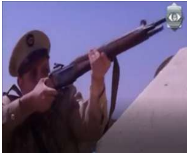
الفوتوغرام رقم ( 74 ) المستخرج من المشهد رقم ( 04 ) .

و في خضم الاشتباكات صورّ العبد و هو يكبر الله حينما أطلق الرصاص صوب جندي كان يسير الرشاش فوق مدرعة ، ليأخذ بعدها الضابط الإنجليزي السلاح من يد جندي و يطلق الرصاص صوب العبد ليصيبه برصاصتين واحدة على مستوى الكتف و الثانية في رأسه .