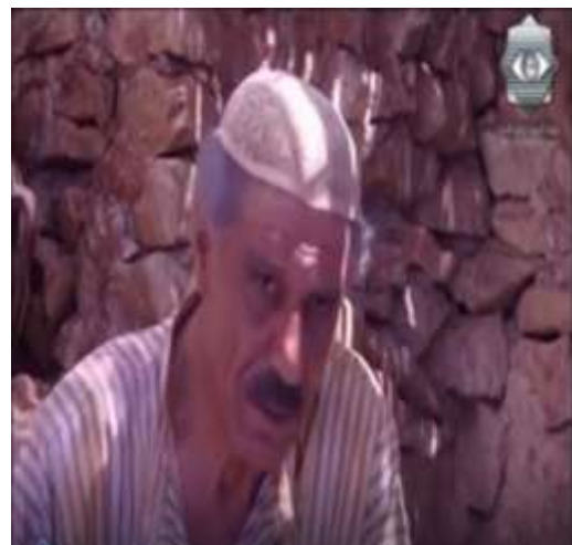
الفوتوغرام رقم ( 19 ) المستخرج من المشهد رقم ( 01 ) . الفوتوغرام رقم ( 20 ) المستخرج من المشهد رقم ( 01 ) .