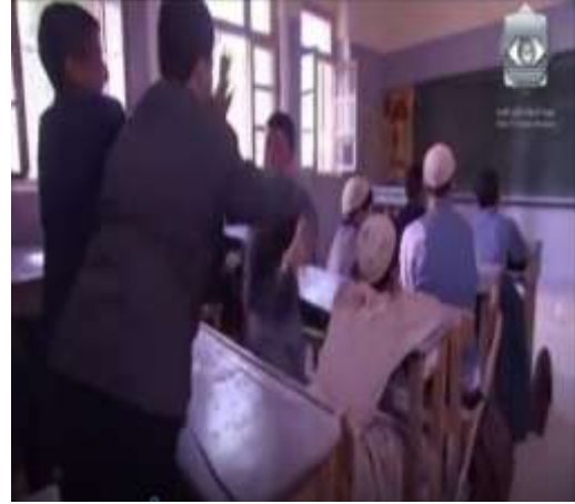
الفوتوغرام رقم ( 32 ) المستخرج من المشهد رقم ( 02 ) . الفوتوغرام رقم ( 33 ) المستخرج من المشهد رقم ( 02 ) .