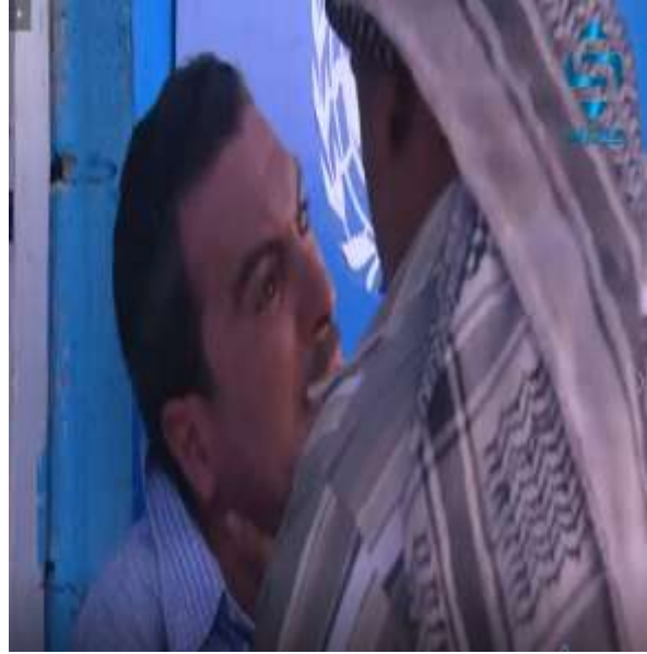
الفوتوغرام رقم ( 118 ) المستخرج من المشهد رقم ( 08 ) . الفوتوغرام رقم ( 119 ) المستخرج من المشهد رقم ( 08 ) .