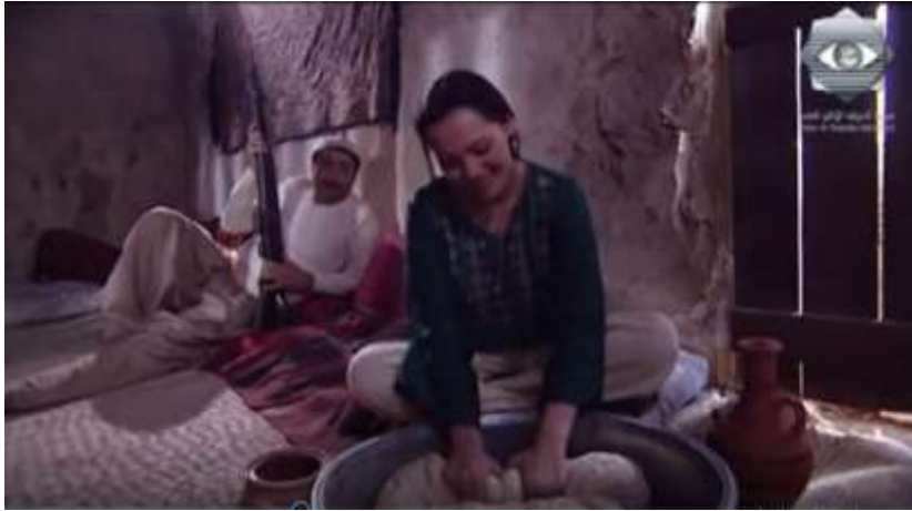
الفوتوغرام رقم ( 53 ) المستخرج من المشهد رقم ( 04 ) .

" بالعكس لما يكون برا بشوفك فيها ، مش اشتريتها بإسوارتك " .