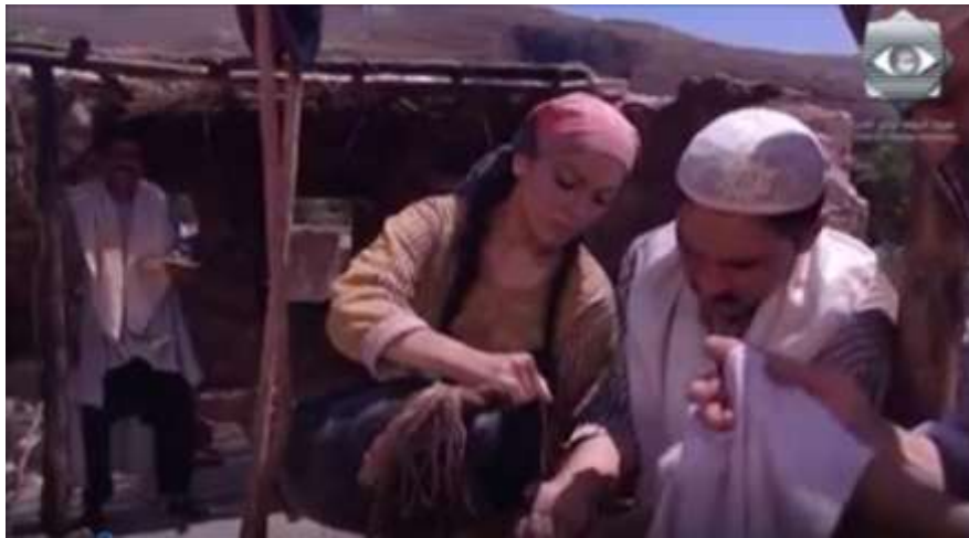
الفوتوغرام رقم ( 22 ) المستخرج من المشهد رقم ( 01 ) .

و في خضم مشكلة أرض المشاع تم تصوير حوار دائر و مطول بين أحمد و مسعود و كذا أبيهم الذي شارك بشكل جزئي في الحوار ، فقد استخدم المخرج حاتم علي زاوية عادية و المجال و عكس المجال لتصوير هذا الجزء من مشهد صورة الفلسطيني الفلاح ، و نوع في استخدام اللقطات من متوسطة إلى خصرية و قريبة و كتفية و الصدرية و الأمريكية و المتوسطة ، أما حركات الكاميرا فكانت متنوعة بين الحركة الثابتة و البانورامية بين البانوراما الأفقية " من اليمين إلى اليسار و العكس " أو البانوراما العمودية " من الأعلى إلى الأسفل و العكس " .