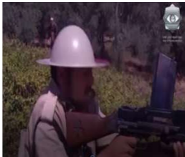
الفوتوغرام رقم ( 72 ) المستخرج من المشهد رقم ( 04 ) .