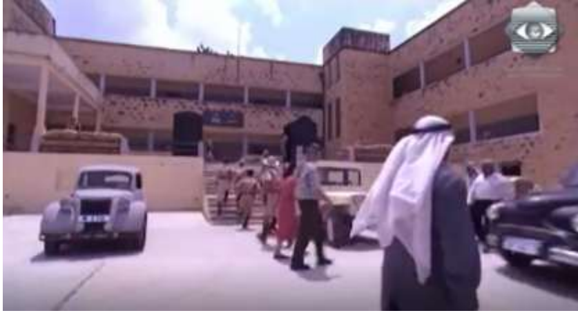
الفوتوغرام رقم ( 41 ) المستخرج من المشهد رقم ( 03 ) .

استفتح المخرج حاتم علي تصوير مشهد المقاوم الجريء بلقطة الجزء الكبير و بزاوية عادية و حركة كاميرا ثابتة حينما صوّر مركز جيش الاحتلال الإنجليزي و بجانبه سيارته ، مع مرور بعض المارة بمختلف مظاهرهم ، و هذا ما يدل على التنوع الثقافي في فلسطين من ناحية اللبس و غير ذلك .