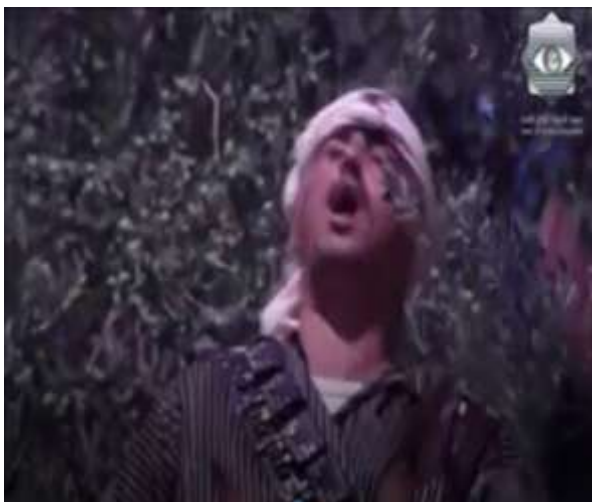
الفوتوغرام رقم ( 75 ) المستخرج من المشهد رقم ( 04 ) .