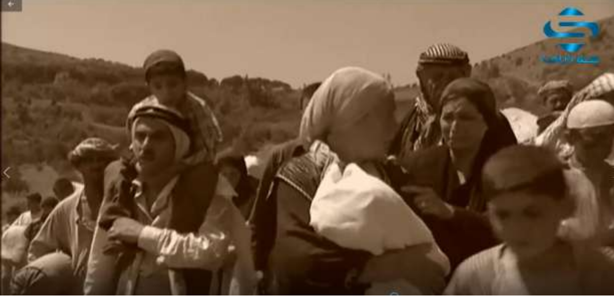
الفوتوغرام رقم ( 110 ) المستخرج من المشهد رقم ( 06 ) .

كلها رسائل لم تكن ضمنية بقدر ما هي واضحة ، هي صور مختلفة تحمل في جعبتها معنى واحد و هو أن النكبة و التهجير و المعاناة هي جوهر القضية الفلسطينية و هي النقطة الفاصلة في مصير فلسطين و شعبها و أن الاحتلال مجرم حرب .