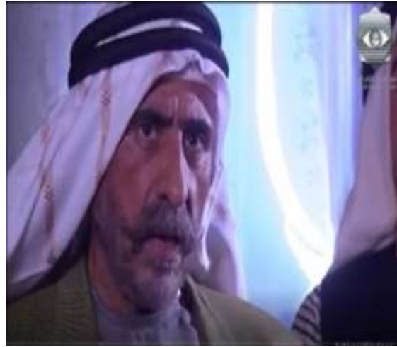
الفوتوغرام رقم ( 07 ) المستخرج من المشهد رقم ( 01 ) الفوتوغرام رقم ( 08 ) المستخرج من المشهد رقم ( 01 ) .

أما زاوية المجال و عكس المجال فقد وظفت هنا بشكل واضح في تصوير الحوار الدائر بينهم . و علّ أول استخدام لها حينما بدأ أبو عايد في الكلام بطريقة استخفافية قائلاً :