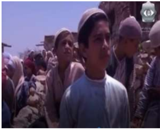
الفوتوغرام رقم ( 88 ) المستخرج من المشهد رقم ( 04 ) . الفوتوغرام رقم ( 89 ) المستخرج من المشهد رقم ( 04 ) .