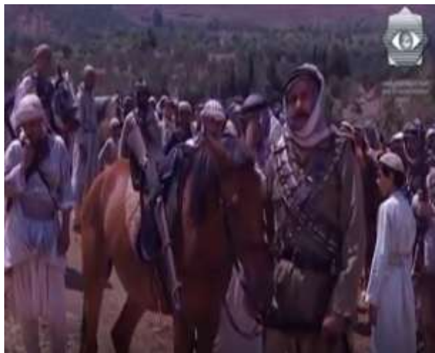
الفوتوغرام رقم ( 91 ) المستخرج من المشهد رقم ( 04 ) . الفوتوغرام رقم ( 92 ) المستخرج من المشهد رقم ( 04 ) .