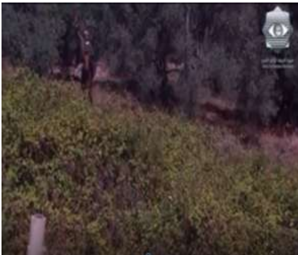
الفوتوغرام رقم ( 73 ) المستخرج من المشهد رقم ( 04 ) .

أيديولوجي في تفكيره و انتمائه كان من الممكن أن يصور الطرف المنحاز له لم يكن لديه إصابات ، و هنا دليل واضح على مصداقية المخرج حاتم علي .