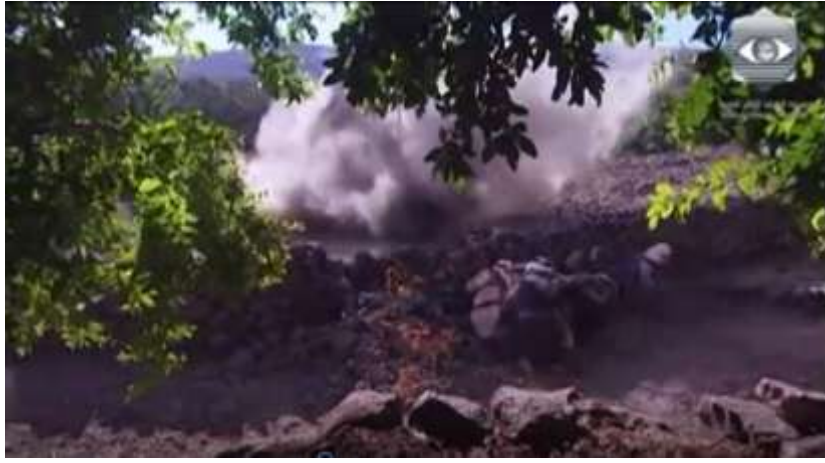
الفوتوغرام رقم ( 61 ) المستخرج من المشهد رقم ( 04 ) .