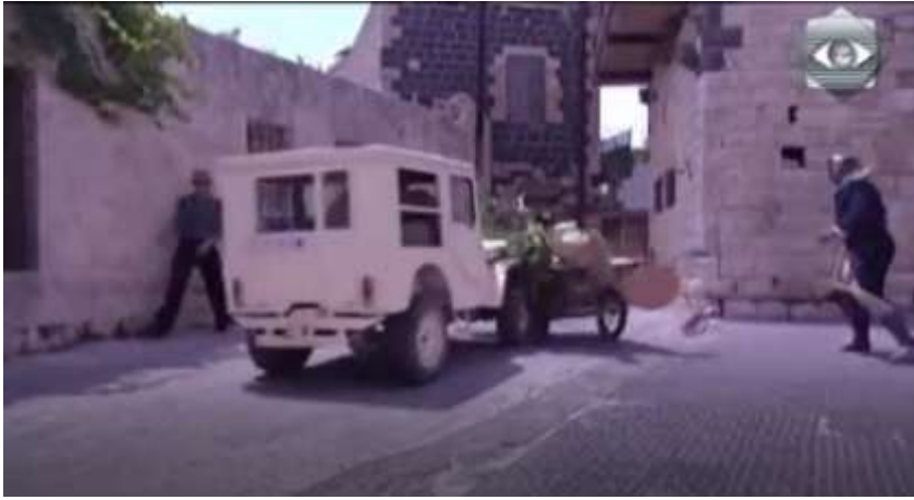
الفوتوغرام رقم ( 47 ) المستخرج من المشهد رقم ( 03 ) .

و من هنا انطلق محور المشهد حيث انتظر أحمد خروج الضابط و بلقطة متوسطة و حركة كاميرا بانورامية من اليمين إلى اليسار و العكس صوّر أحمد و هو يدفع بعربته أمام سيارة جيش الاحتلال الإنجليزي و التي يركبها الضابط الإنجليزي و عرقل بها سيرها .