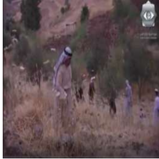
الفوتوغرام رقم ( 01 ) المستخرج من المشهد رقم ( 01 ) . الفوتوغرام رقم ( 02 ) المستخرج من المشهد رقم ( 01 ) .

و قد استخدم و نوع المخرج في الحركات في هذا المشهد ككل من حركات ثابتة و التنقل المصاحب و التنقل الخلفي و زووم اوت حيث كان النصيب الأكبر في هذا المشهد للحركات البانورامية الأفقية " من اليمين إلى اليسار و العكس " و البانورامية العمودية " من الأعلى إلى الأسفل و العكس " .