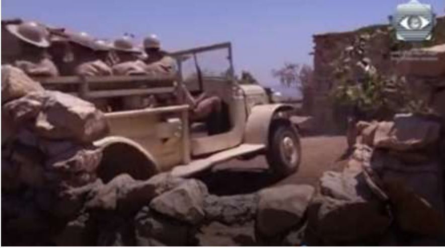
الفوتوغرام رقم ( 93 ) المستخرج من المشهد رقم ( 04 ) .

و بعد فهم خضرة أن العبد استشهد حينما تقدم أحمد بحصان العبد و هو ينظر إلى خضرة حيث تم تصويره بحركة كاميرا بانورامية من الأسفل إلى الأعلى ثم من اليسار إلى اليمين ، تم تصويرها و هي تمسك برأسها و بعدما كانت الحركة ثابتة ثم بانورامية من اليمين إلى اليسار ثم التنقل المصاحب ثم تغيرت إلى التنقل المصاحب حيث تتبعت الكاميرا خضرة و هي تسير صوب الحصان إلى حين وصولها إليه و ظهرت بلقطة أمريكية و هي تمسكه و تبكي و وظفت أغنية للمقاومين كانت هاته الأغنية معبرة جدا حالة العبد و خضرة بشكل عام و الفلسطينيين بشكل خاص .