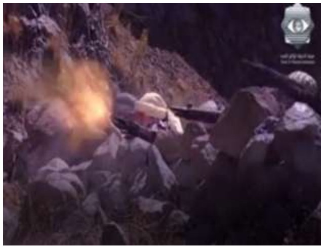
الفوتوغرام رقم ( 66 ) المستخرج من المشهد رقم ( 04 ) .