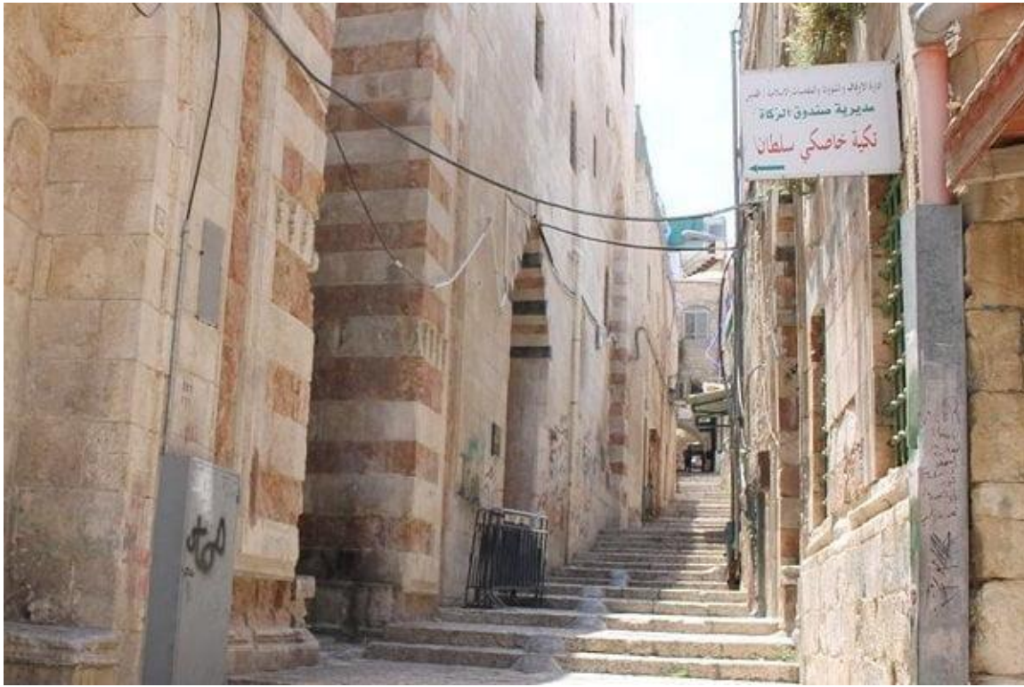
الملحق رقم 04: مدرسة عاتكة خاتون بنت السيد علي نقيب