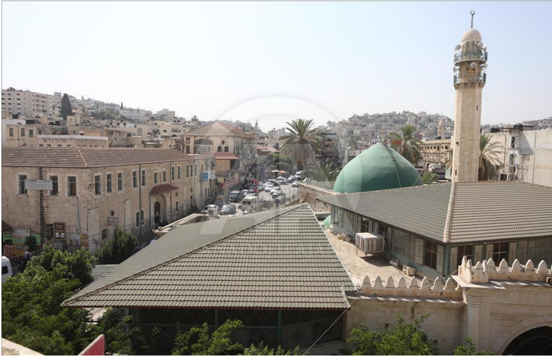
الملحق رقم 03: تكية خاصكي سلطان