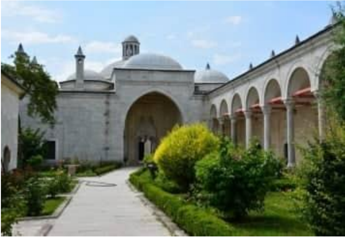
دار الشفاء كلنوش.