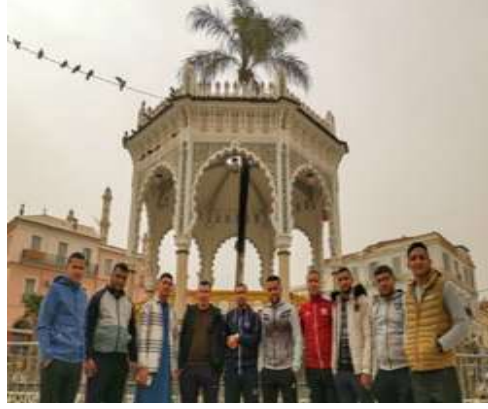
شباب الجمعية للرحلة الربيعية التربوية السادسة التي حملت شعار