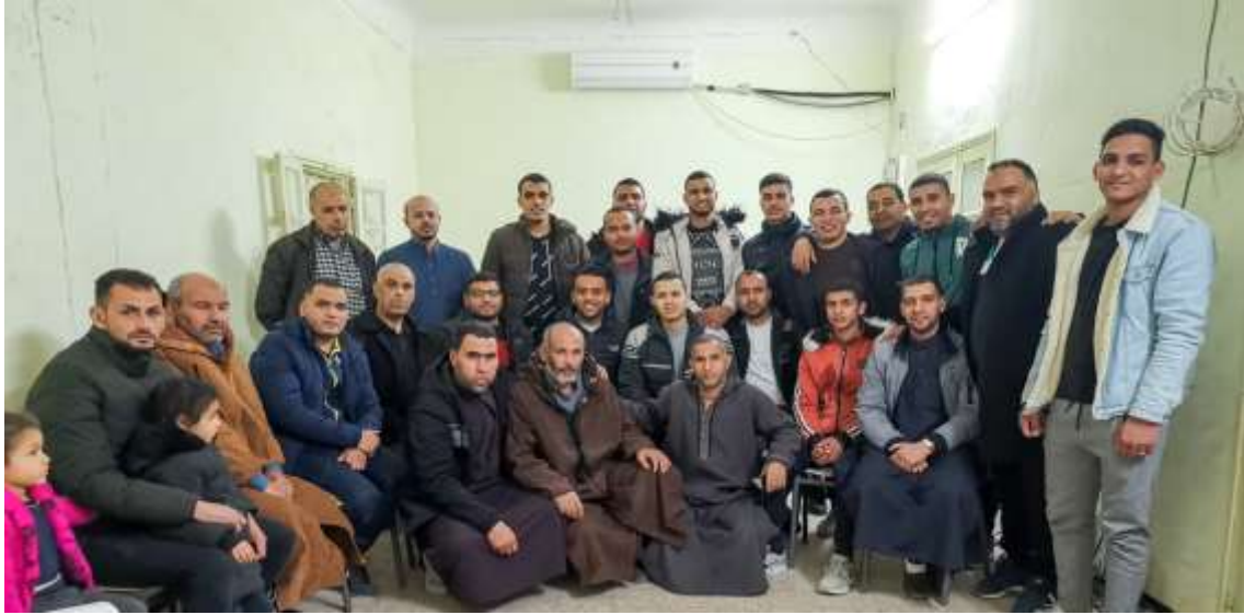
اليوم الاول من الرحلة الربيعية تم التوجه الى جبال الشريعة ثم الاستحمام في حمام ملوان