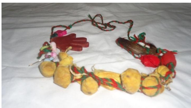
صورة جلاب الختان