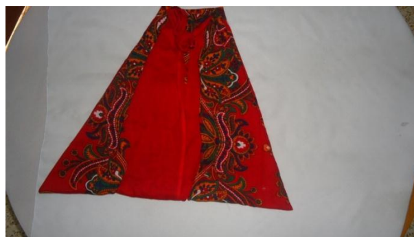
صورة مرحمة الختان