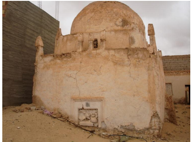
صورة زاوية الشيخ الإمام الشريف وضريحه