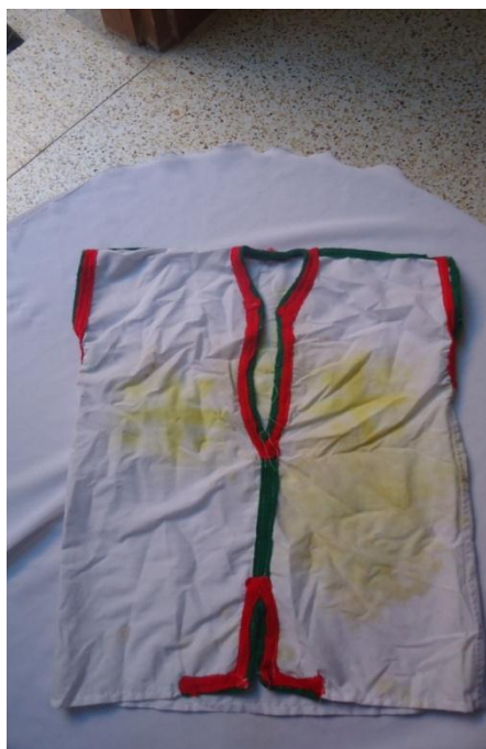
صورة جبة الختان