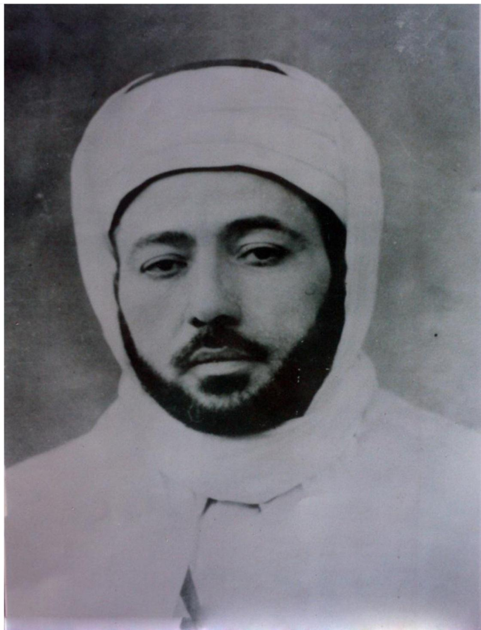
الشيخ عبد العزيز بن الهاشمي الشريف