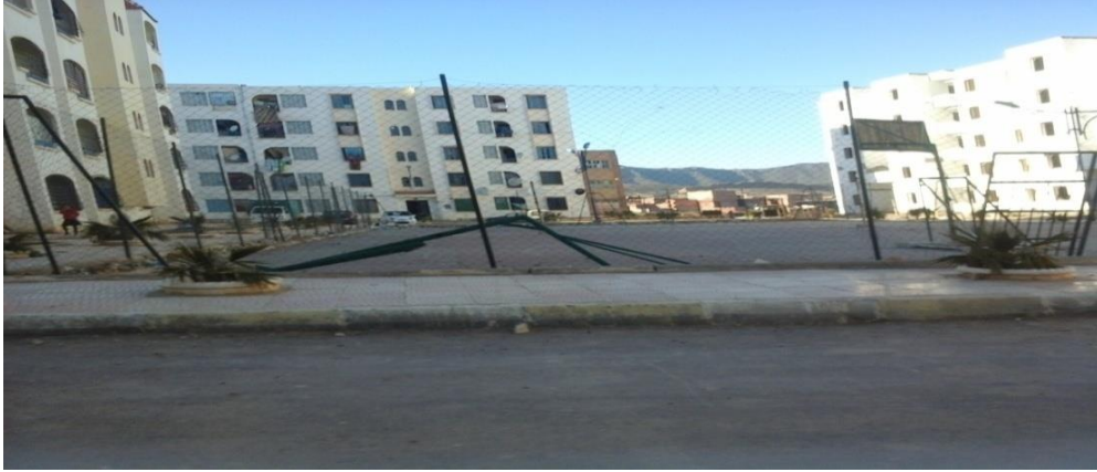
المصدر ، الباحثة ،المدينة الجديدة حملة 1، 2014/03/24

(الشكل 06 ) صور توضح مظاهر الإهمال و التخريب الذي تعرضت له بعض الملاعب و المساحات الخضراء