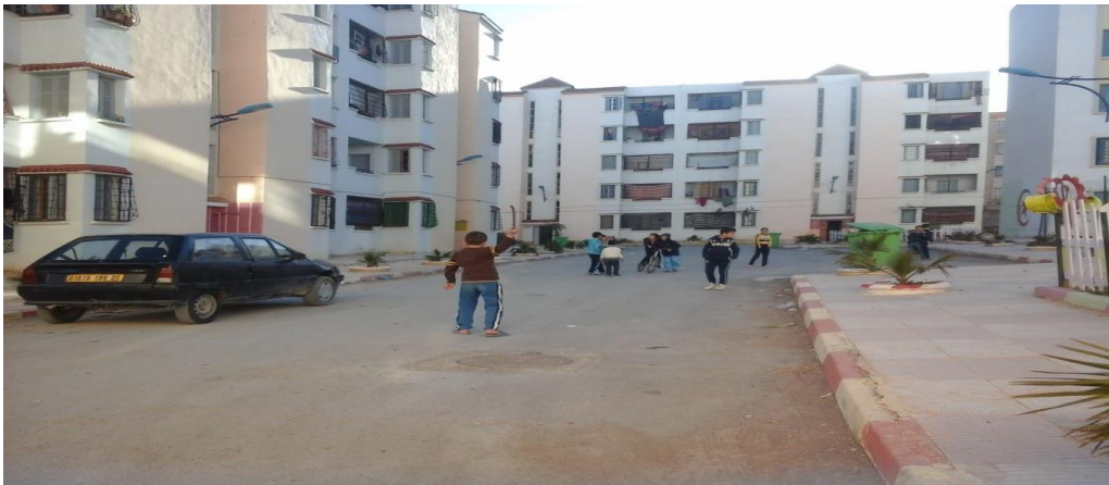
المصدر ، الباحثة ،المدينة الجديدة حملة 1، 2014/03/24

5- تحول الفضاءات العمومية العامة كساحات المجمعات السكنية و مداخل العمارات و مواقف السيارات لفضاءات للعب الأطفال. (الشكل 05 ) صورة توضح لعب الأطفال في الساحات العمومية وسط العمارات في مواقف السيارات