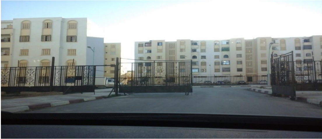
المصدر ، الباحثة ،المدينة الجديدة حملة 1 ، 2014/03/24

(الشكل 02) : صور توضح لجوء السكان الى تسييج الأحياء السكنية بالأسوار الفولاذية لحماية الأطفال و الممتلكات .