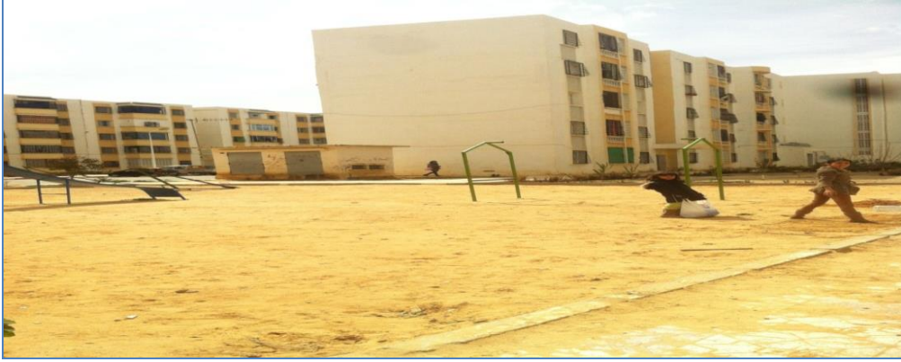
المصدر ، الباحثة ،المدينة الجديدة حملة 1، 2014/03/24