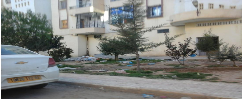
المصدر ، الباحثة ،المدينة الجديدة حملة 1، 2014/03/24