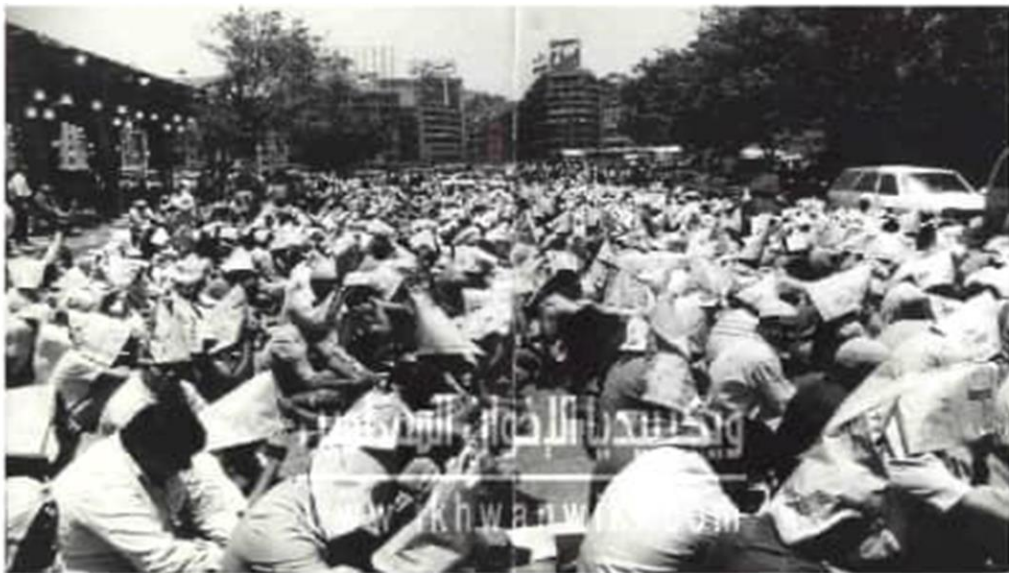
جنازة الأستاذ عمر التلمساني

الملحق 03: خطه وتوقيعه (المصدر: محمد خير رمضان يوسف, تنمية الأعلام, مرجع سابق)