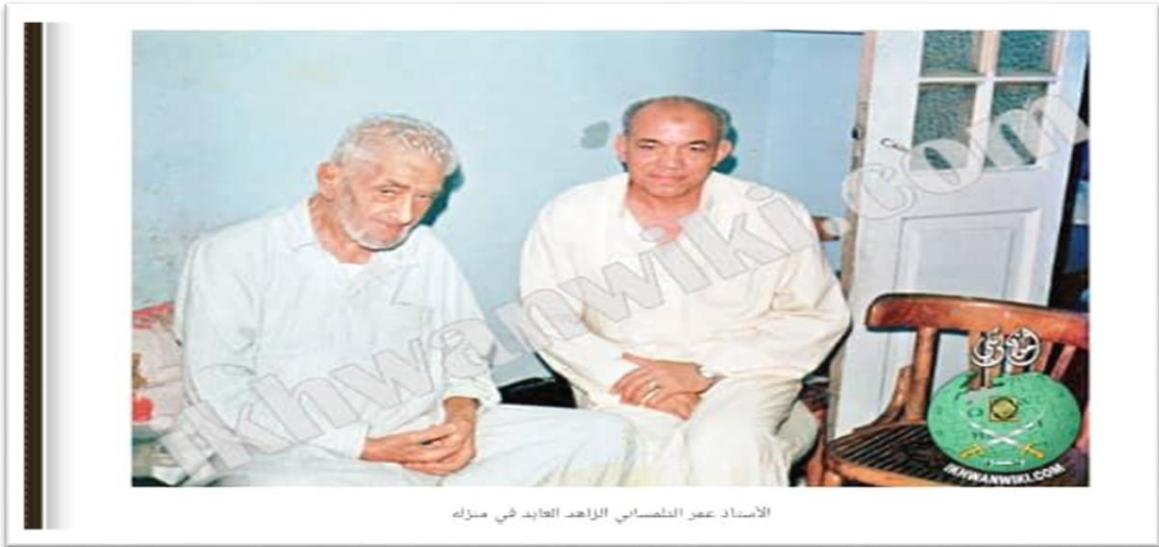
الأستاذ عمر التلمساني الزاهد العابد في منزله