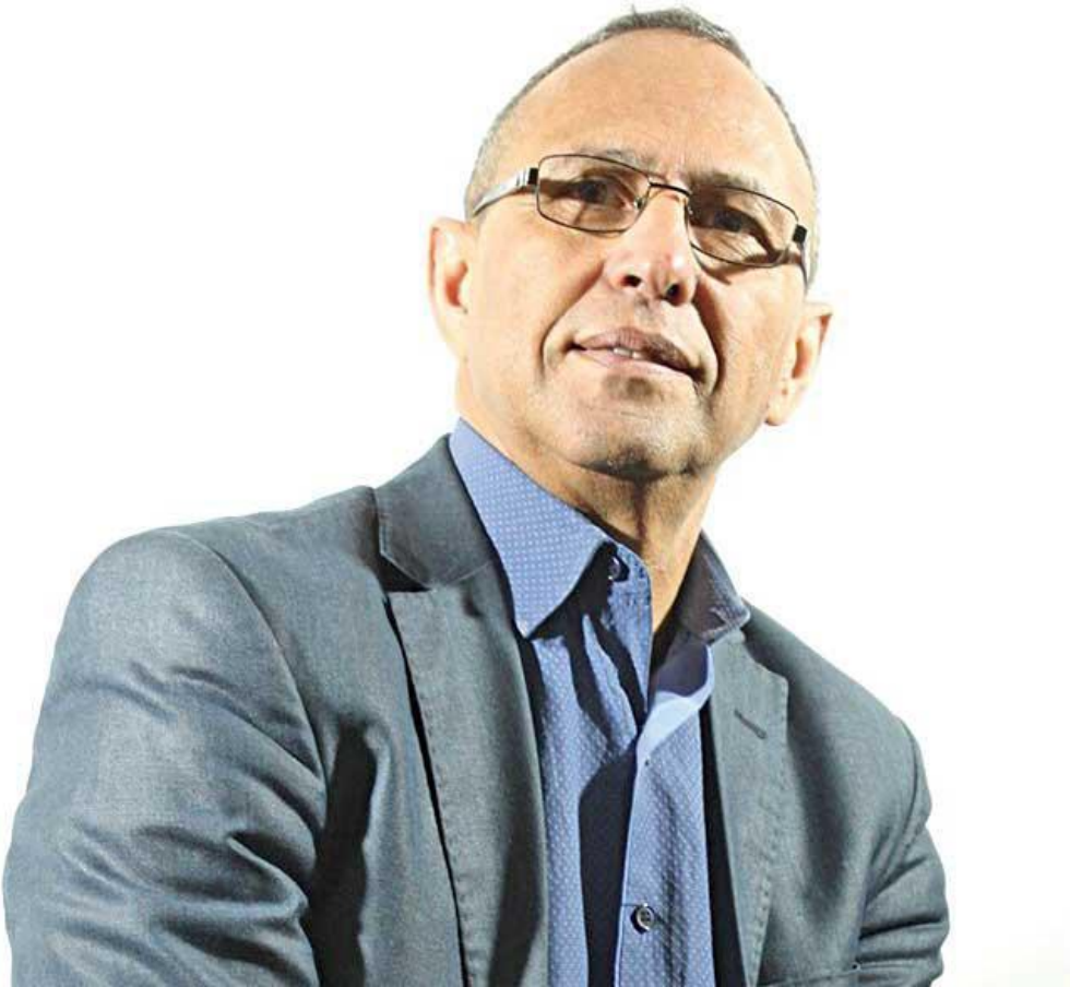
الصورة 01: الاديب عز الدين جلاوجي

عز الدين جلاوجي اديب وأكاديمي جزائري صدرت له عشرات الاعمال الإبداعية والنقدية وكتب فيها عديد البحوث العلمية والرسائل الجامعية داخل الوطن وخارجه ويعد من المؤسسين للاتجاه الجديد في الكتابة المسرحية، وقد نشر اعماله الأولى في بداية الثمانينات. وقد تميزت كتاباته بالتنوع، إذ كتب في جميع الفنون وقد نشر قسم منها في الجرائد والمجلات الوطنية والعربية وقد ضمت حوارات له فيها وفي الإذاعة الوطنية والتلفزيون. كان عضوا مؤسساً ورئيس رابطة اهل القلم الولائية بسطيف منذ 2001. وعضوا بارزا في اتحاد الكتاب الجزائريين (2000-2003). كما أشرف على تنظيم عديد النظاهرات الثقافية.