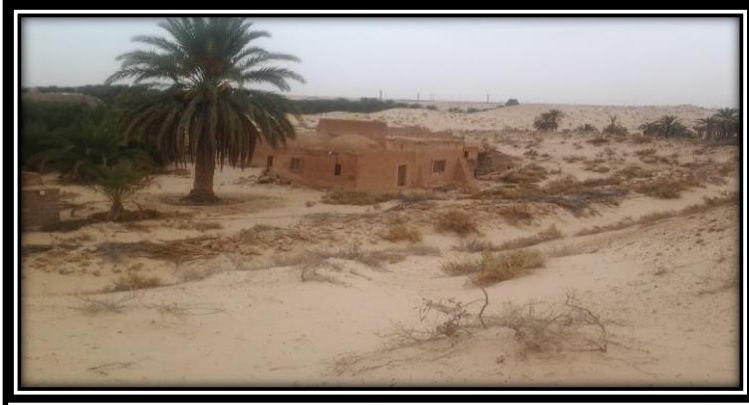
صورة (02): أحد المنازل المشيدة قرب الغيطان