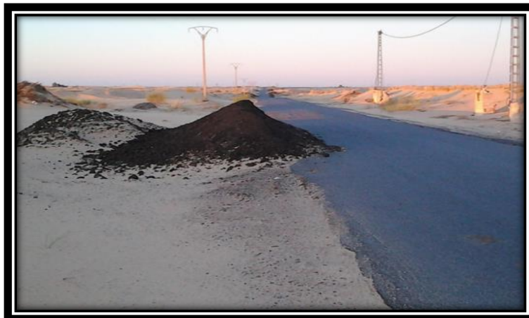
صورة (04): وضع الأسمدة على حافة الطريق بشكل يهدد سلامة السائقين

تنطوي عملية نقل الأسمدة العضوية الطبيعية على العديد من المخاطر البيئية المتعددة، منها انتشار الروائح الكريهة المنبعثة منها ملوثة للجو على مدار الساعة، والتي تؤرق الأحياء السكنية خاصة في فصل الصيف حيث يكون قضاء أوقات الليل في الأفنية أو خارج البيوت إضافة إلى انتشار القوارض والطفيليات المختلفة والتي لم تكن تعرف في المنطقة، أما الطرق الرئيسية التي تمر منها شاحنات النقل فغالبا ما تكون عرضة لسقوط الفضلات التي تشوه مشهد الأوساط الحضرية، أما على المستوى الصحي فمن شأن هذه الفضلات التسبب في انتشار العديد من الأمراض والأوبئة، وتتسبب الفضلات المركونة على حواف الطرق في العديد من حوادث المرور خاصة أثناء الليل بفعل وضعها المفاجئ والخطير 1 .