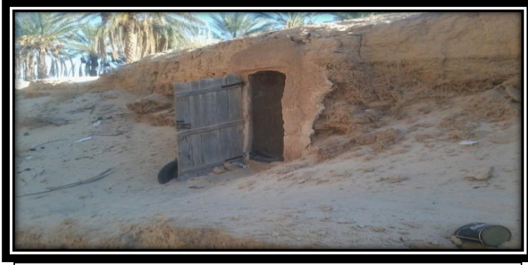
صورة (01): مدخل "الكيب" موضحا اتجاهه للشمال - الظل-

- الزربية: وهي عبارة عن مسكن مؤقت يستخدم من طرف البدو والحضر وتعتبر ملجأ من جريد النخيل نجدها بأعداد كبيرة خاصة في الجنوب ضواحي الوادي بالبياضة وعميش وتعتبر سكنا وسطا ما بين الخيمة والمنزل، فالرحل الذين هم في طريقهم للتحضر والاستقرار والذين ليس بإمكانهم الحصول على منزل أو لا يتحملون العيش في الأماكن المغلقة لتعودهم على حياة الصحراء يمرون بالزربية كمرحلة تطور، وأثبتت الدلائل التاريخية أن سكان سوف الأوائل اعتمدوا الزربية المشيدة بجريد النخل مأوى لهم منذ القدم، "فالرحالة العياشي الذي مر بأرض سوف في حدود 1662م"، قال: "حين وصلنا إلى الوادي وجدنا طرودا (قبيلة)، يسكنون زرائب من جريد النخل، وبها يخزنون ما يحتاجون".