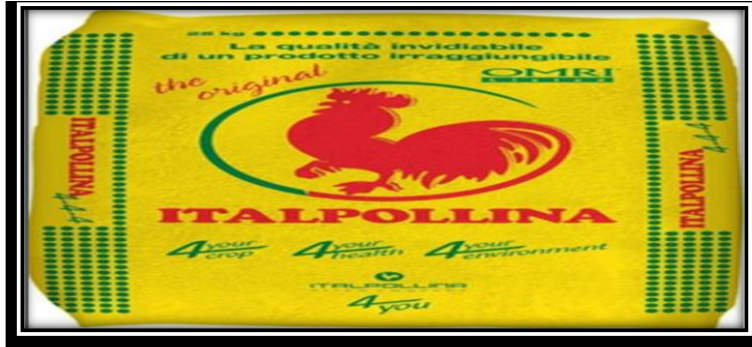
صورة (03): السماد العضوي المستخدم

في نقل الأكسجين للدم، كما تتكون مركبات النيتروزامين التي تسبب أمراضاً سرطانية وأوراماً خبيثة.