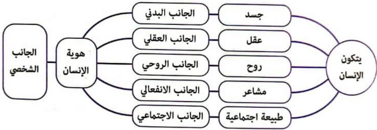
الشكل 03 : يبين الجوانب التي يتكون منها الإنسان

إن أي إنسان يتكون من جسد وروح وعمل ومشاعر وطبيعة اجتماعية، وهذه الأجزاء هي التي تكون شخصية الإنسان، لذلك يجب أن ننمي في كل إنسان الجانب الجسمي والروحي والعقلي والانفعالي والاجتماعي لكي يكتمل بها جميعا الجانب الشخصي، وهو ما يوضحه الشكل التالي: