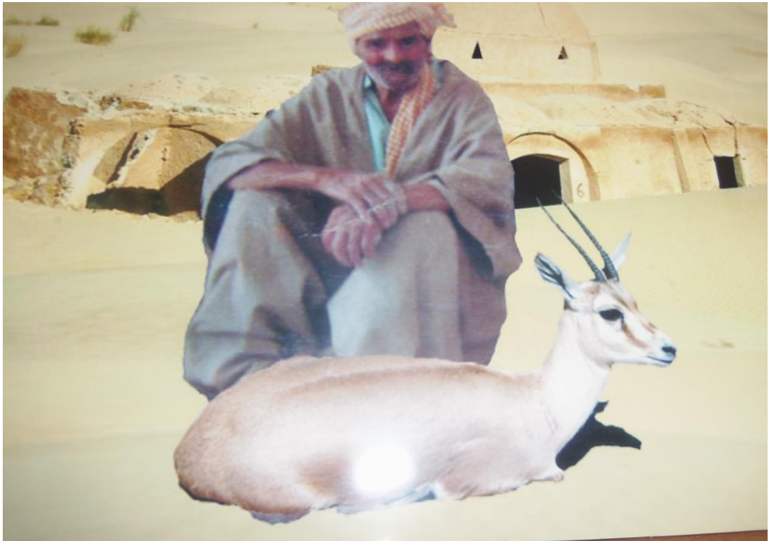
جامع الزاوية القادرية قديم جدا