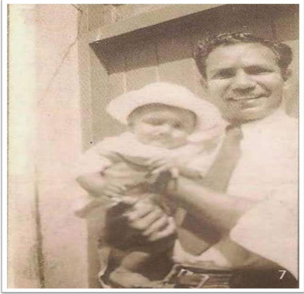
صورة نادرة للشيخ أحمد ديدات مع ابنه