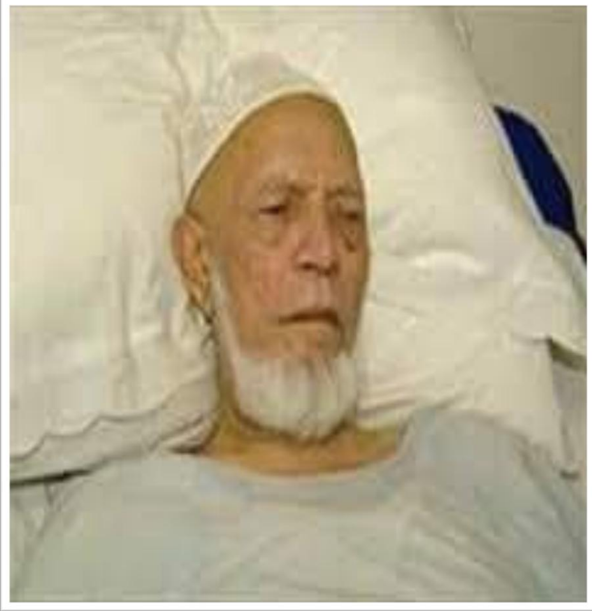
صورة للشيخ أحمد ديدات على فراش المرض