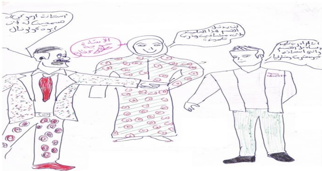
الرسم (2) من المجموعة الأولى

هذه المؤشرات توضح لنا مدى العدوانية التي يشعر بها التلميذ نتيجة عمق احباطاته وعدم شعوره بالأمن داخل الثانوية، من منطلق أن المعرفة المدرسية هي ليست من حقه وأنه لا يملك الحق في امتلاكها لأنه لا تتوفر فيه الشروط الاجتماعية للحصول عليها، هذه المؤشرات تتقاطع مع فكرة أن مضمون التمثل كموضوع خارجي يحمل شكل بضاعة لها زبائنها وهو لا يملك القدرة على الحصول عليها، هذه العلاقة السلبية مع موضوع المعرفة الذي هو موضوع سيء لأنه يضع التلميذ في مواجهة مع الصورة السلبية عن ذاته وللتخلص من هذه المواجهة ما عليه إلا إقصاء الموضوع المؤلم، هذا ما اقترحتة Klein عندما فسرت ميلنا إلى إلغاء الموضوع السيئ نتيجة الوضعية اكتئابية، التي نمر بها عند انفصال عن الموضوع المؤلم.