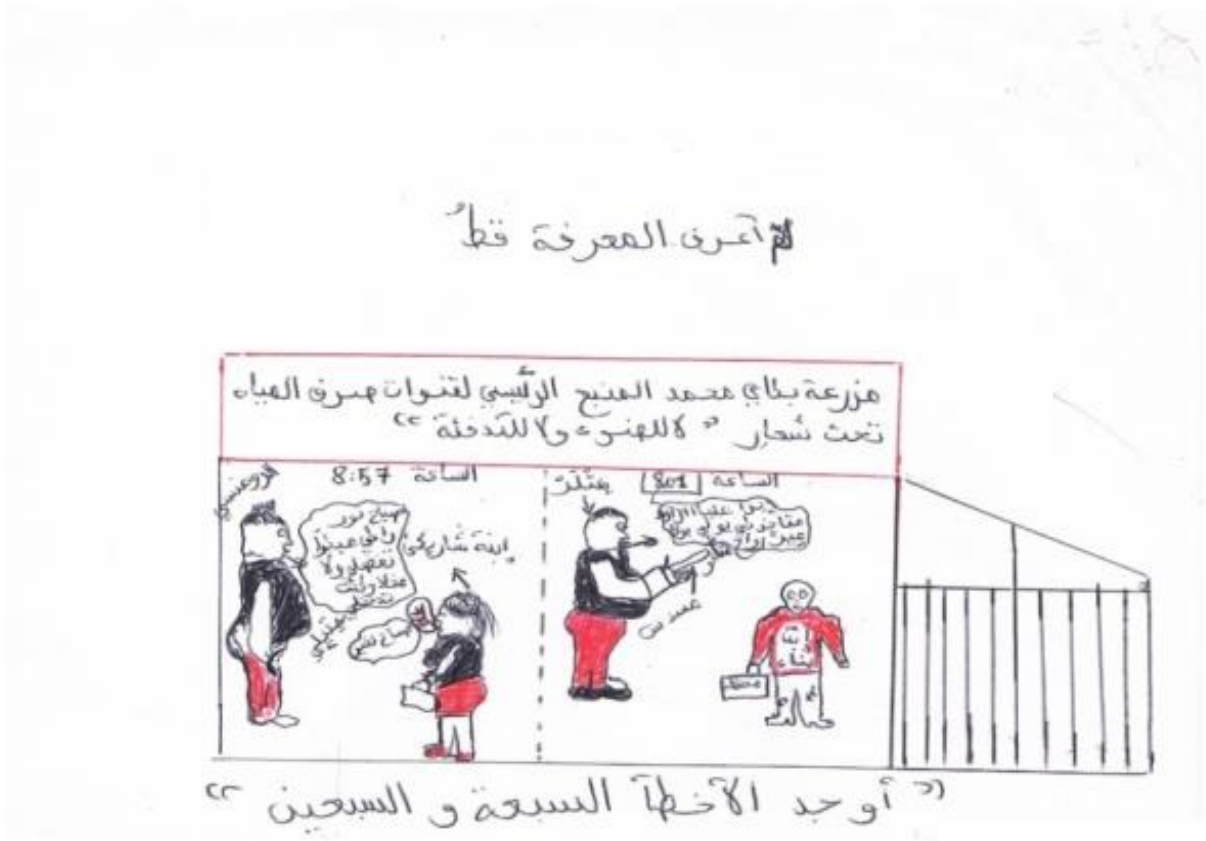
الرسم (1) من المجموعة الأولى

اللون هما شكلين لتعبير عن الجانب الوجداني للشخص وأن كل التنوع في استخدام الألوان فهذا مؤشر على تنوع مشاعر الفرد. (Royer,2005, 175)