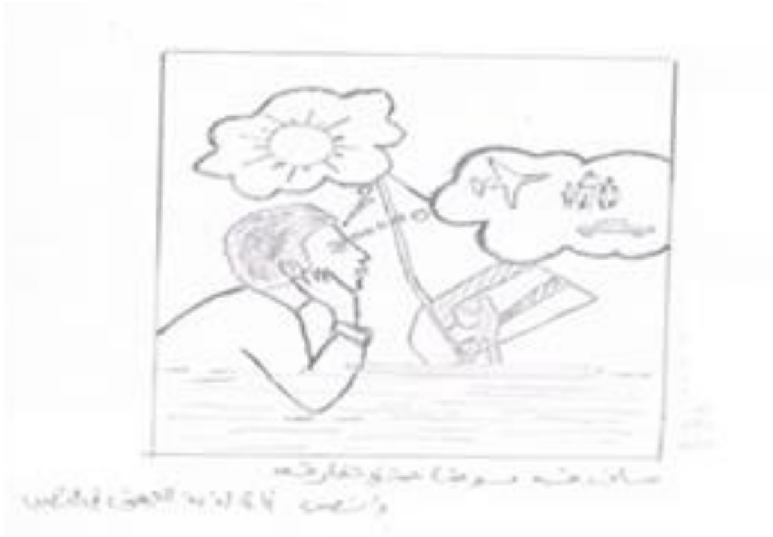
الرسم (6) من المجموعة الرابعة

رابعاً: تحليل المؤشرات التخطيطية الخاصة بالمجموعة الرابعة: المعرفة المدرسية ليست وسيلة لتحقيق النجاح والطموحات.