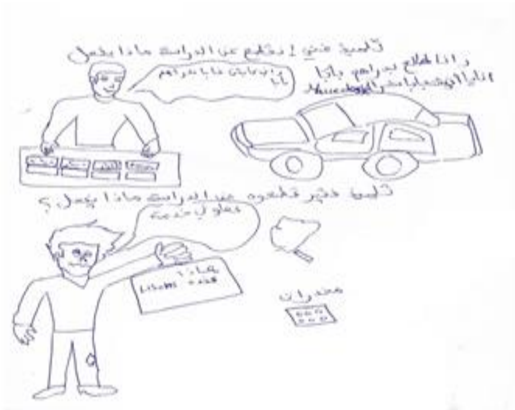
الرسم (7) من المجموعة الرابعة

رابعاً: تحليل المؤشرات التخطيطية الخاصة بالمجموعة الرابعة: المعرفة المدرسية ليست وسيلة لتحقيق النجاح والطموحات.