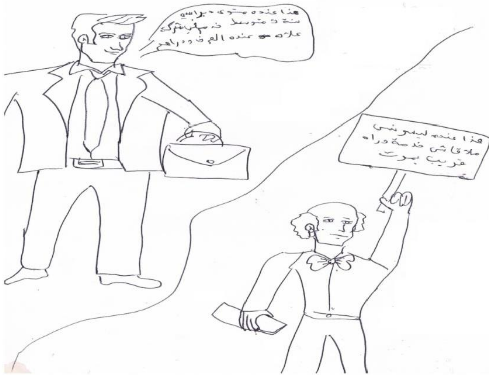
الرسم (8) من المجموعة الرابعة

الرسم (7) للتلميذ (ب. ك. شعبة علوم الطبيعة والحياة) نلاحظ أن هناك مقارنة بين وضعيتين الوضعية الأولى تمثلت لشخص راشد مستواه الدراسي سنة أولى متوسط ولكن الوضع الاجتماعي لوالده يجعل منه شخصا ناجحا مدير الأعمال وهو سعيد في حياته، أما الوضعية الثانية فتمثل شخصا متقدما في السن ما زال يبحث عن العمل بالرغم من حصوله على شهادة التي هي سبب تعاسته. أما الرسم (8) تم إعادة إنتاج الوضعية من طرف التلميذ (ن. ك. شعبة أداب وفلسفة) الذي وضع مقارنة بين شخص أصبح راشدا ناجحا لأن وضعه الاجتماعي ساعده في ذلك، يشعر بسعادة وهو يعد النقود ويملك سيارة آخر طراز التي تعبر عن نجاحه اجتماعيا ما شخص الحامل لشهادة تحول إلى شخص فقير ومدمن موقع الوضعية الأولى (أعلى يمين) التي تدل على ما يريده أن يكون عليه التلميذ والوضعية الثانية (أسفل يسار) التي تعبر عن القلق والخوف مما سيؤول إليه مستقبلا، ما يمكن ملاحظته في رسومات هذه المجموعة هي إسقاط كل ما هو سلبي على موضوع المعرفة المدرسية في شخصية حامل الشهادة العلمية.