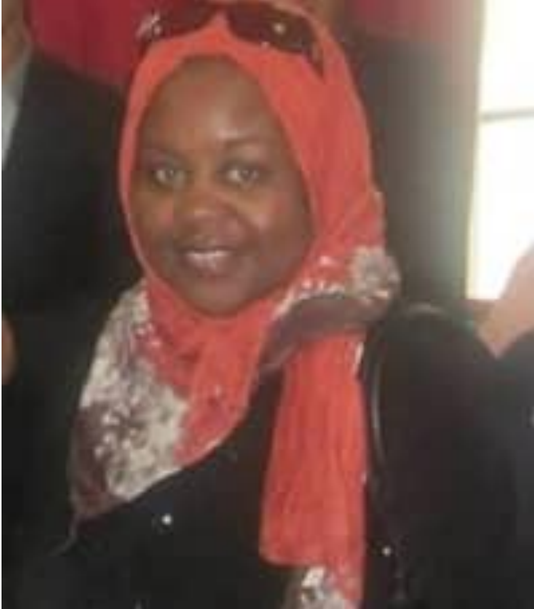
صورة (1.1) الروائية عائشة بويبة