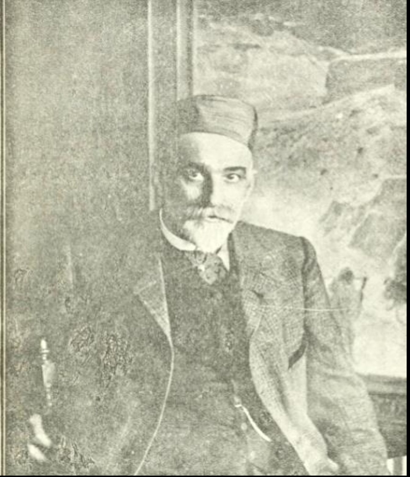
السيد ناصر الدين دينيه