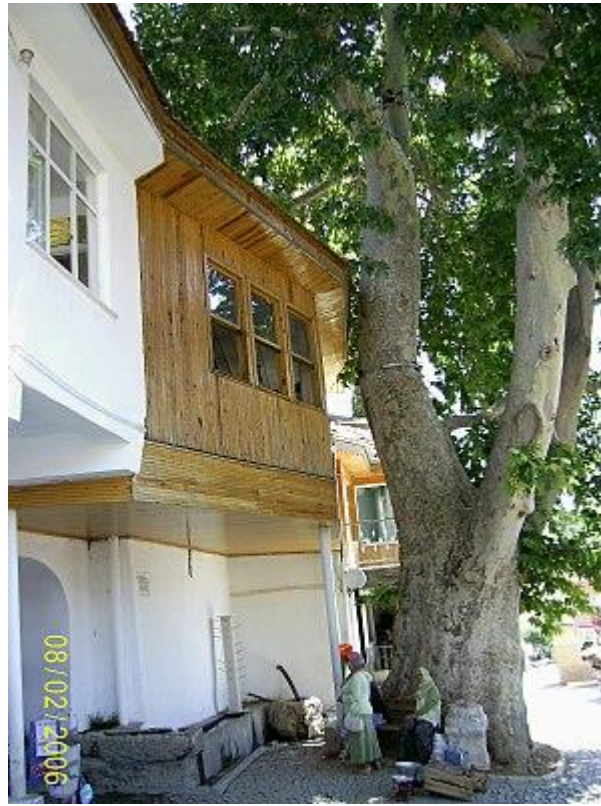
أول مدرسة نورية للأستاذ بديع الزمان سعيد النورسي