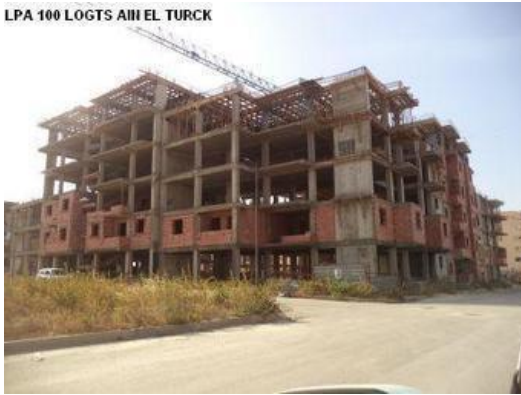
Fig. 2. Logements LPA d'Ain Turk.

Ce système de construction est presque le même sur tous le territoire Algérien avec les mêmes matériaux de construction.