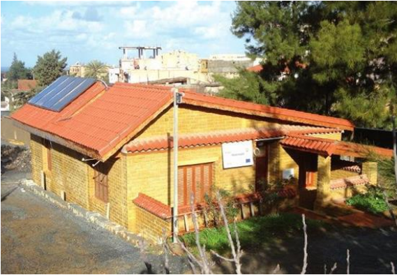
Fig. 4. Une maison pilote bioclimatique à Souidania (Alger).

Ainsi qu'un prototype conçu et réalisé par le Centre national d'études et de recherches intégrées du bâtiment (Cnerib) en collaboration avec le CDER (Centre de développement des énergies renouvelables).