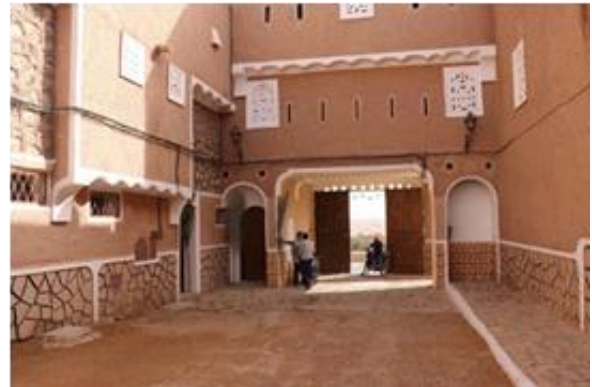
Figure.5. Maison Type Ksar Tafillelt (Ghardaïa).