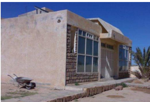
Figure.4. un prototype du village solaire Ain Haneche( Boussaâda ).

Un ensemble des chercheurs algériens en collaboration avec d'autres étrangers, au niveau du centre de recherche en architecture et urbanisme d'El-Harrach, se sont mis en équipe composée d'architectes et thermiciens et commençant à réfléchir tout en remettant en question le problème de la surconsommation en énergie des modèles d'habitat existant, et essayer ainsi de trouver des alternatives pour proposer des types d'habitat dites « solaire », d'où 3 prototype d'habitation sont conçus dans le but de créer des villages solaires intégrés ». Le village solaire est situé à Ain haneche dans la région de Boussaâda à la wilaya de Msila, où l'étude thermique élaborée par l'équipe du centre de recherche sur 3 prototypes avec des données climatiques de la zone semi-aride [7].