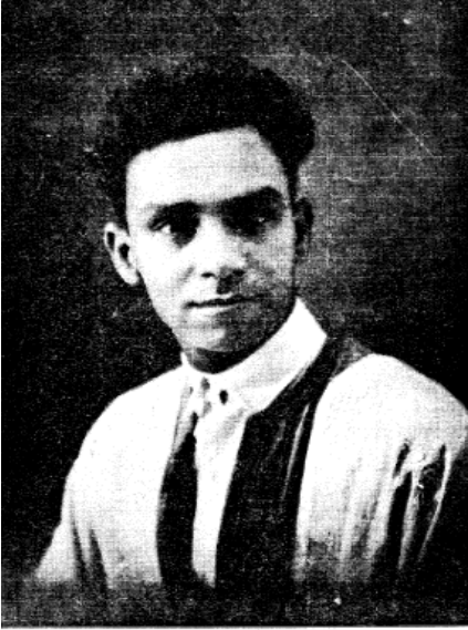
صورة الشابي عام 1930