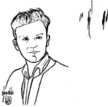
أبو القاسم شابي