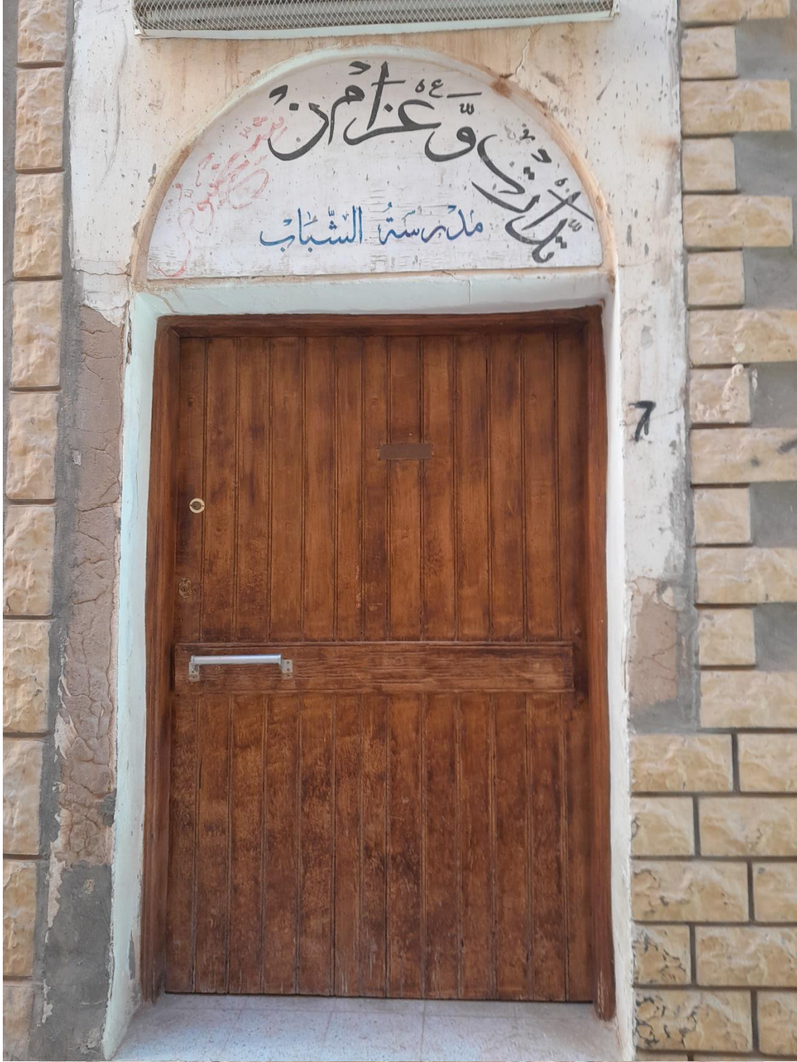
صورة ملحقة رقم (2-1) صورة مقربة لباب بيت الشيخ إبراهيم بيوض ويظهر فيها اسمه.