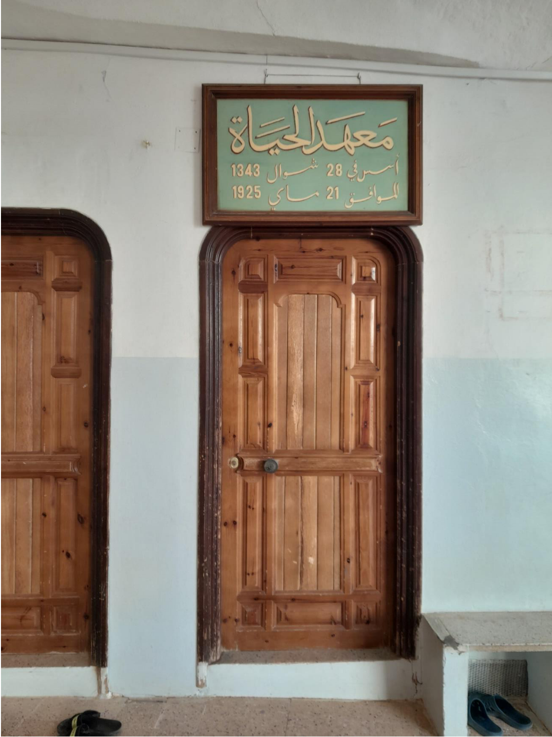
صورة لباب بيت الشيخ إبراهيم بيوض.