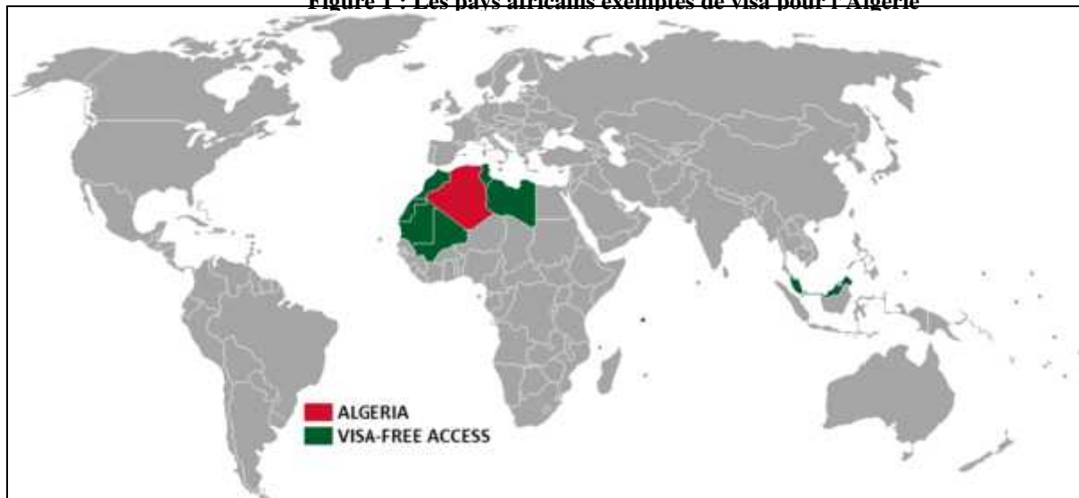
Figure 1 : Les pays africains exemptés de visa pour l'Algérie

Dans le sens inverse, sur les cinquante quatre (54) pays, l'Algérie exempte uniquement sept (7) pays de visa à savoir : Libye, Mali, Mauritanie, Maroc, République démocratique arabe sahraoui, Seychelles, Tunisie