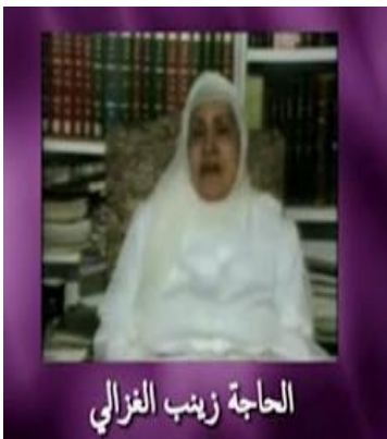
الحاجة زينب الغزالي