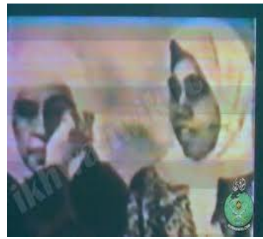
قبل الدخول لسماع الحكم