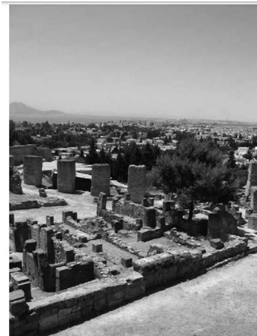
الملحق رقم 2: صورة ملتقطة حديثا توضح معالم قرطاج القديمة